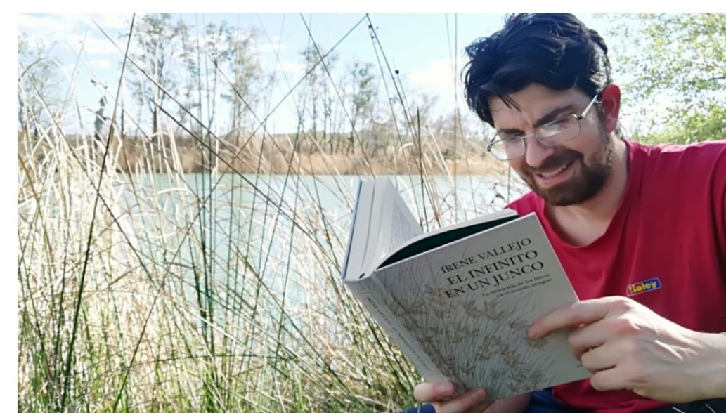
L'infinít dins d'un jonc