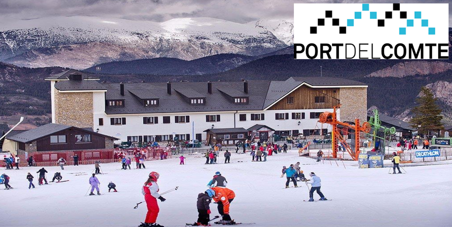
HOTEL PORT 1730