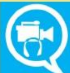
Imagen y Sonido