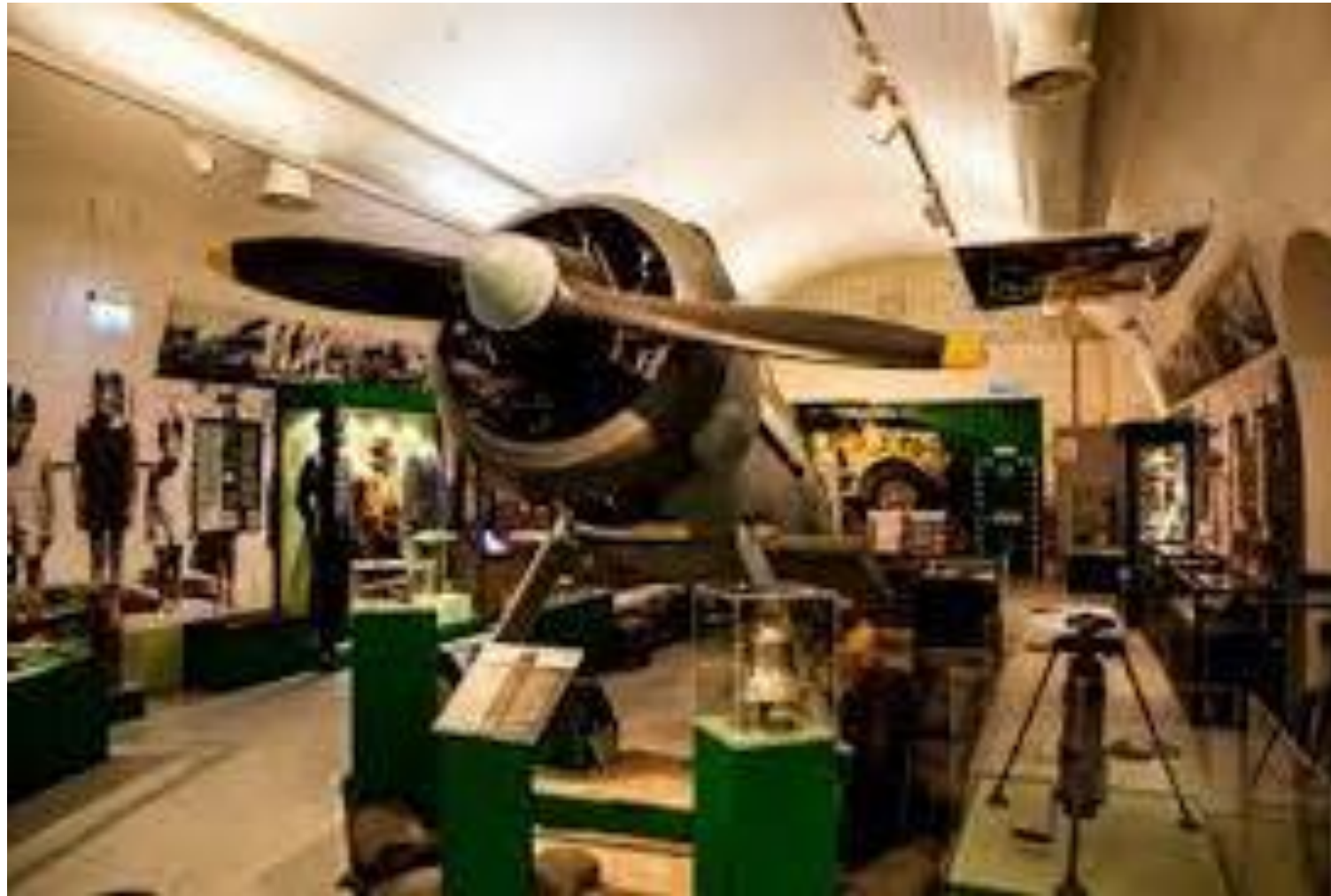
Museos de la Guerra de La Valletta