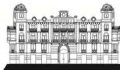
Palau de Castellfort C/ Caballeros, 9 - 46001 València