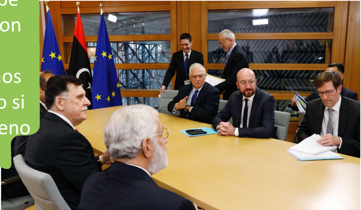
El presidente Michel y Josep Borrell se reúnen con el primer ministro de Libia (8.1.2020, Bruselas)

«La Unión no debe hacer negocios con regímenes que violan los derechos humanos, incluso si el trato fuese bueno»