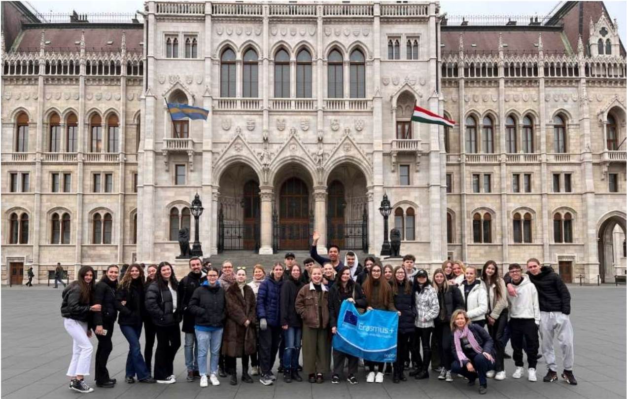
Foto grupal durante el intercambio en Hungría en marzo 2023