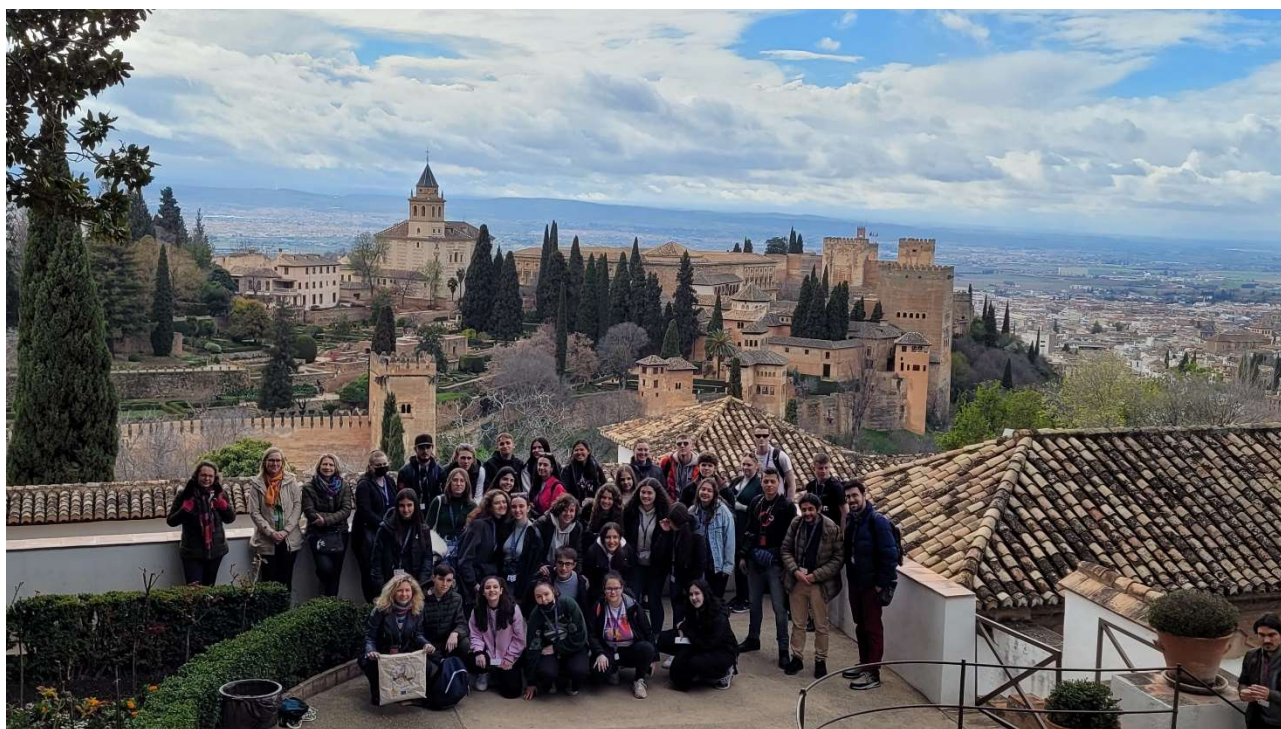
Visita a la Alhambra durante el intercambio en España en marzo 2022

https://portal.edu.gva.es/iesgabrielmiro/erasmus/proyecto-k2/2020-1-hu01-ka229-078749_3/