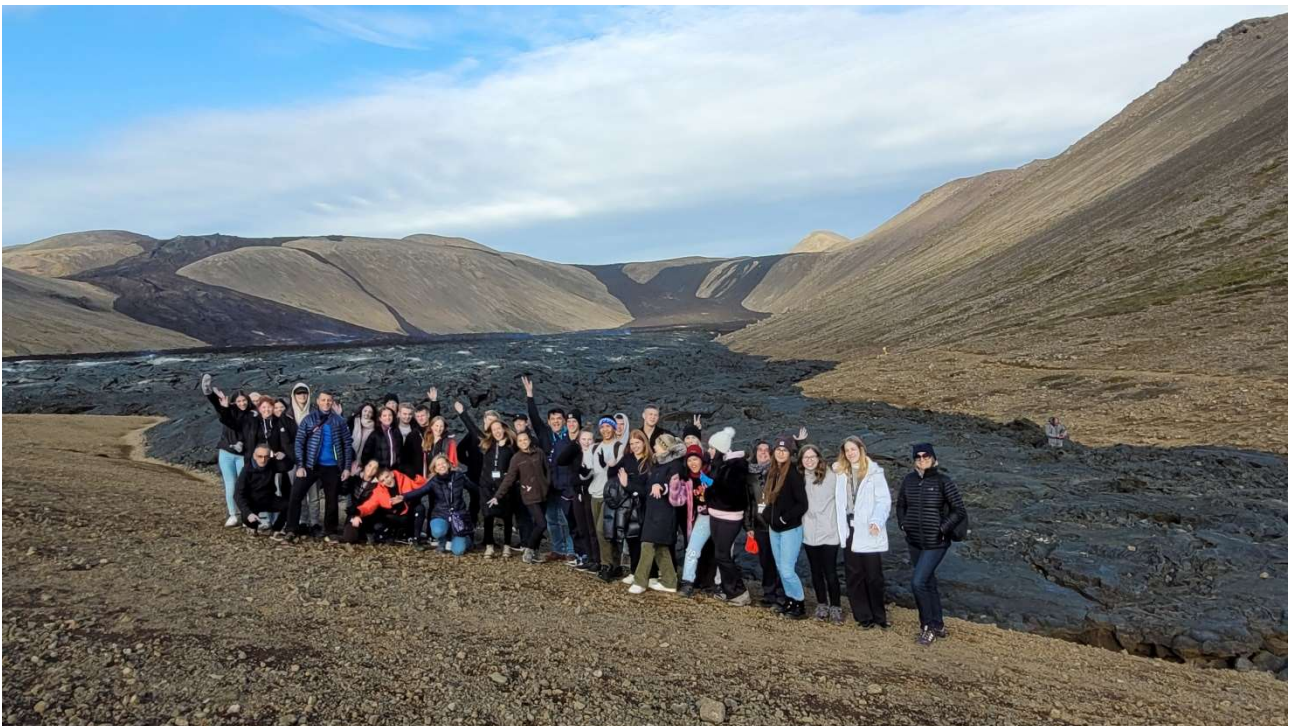
Foto grupal durante el intercambio en Islandia en septiembre de 2022