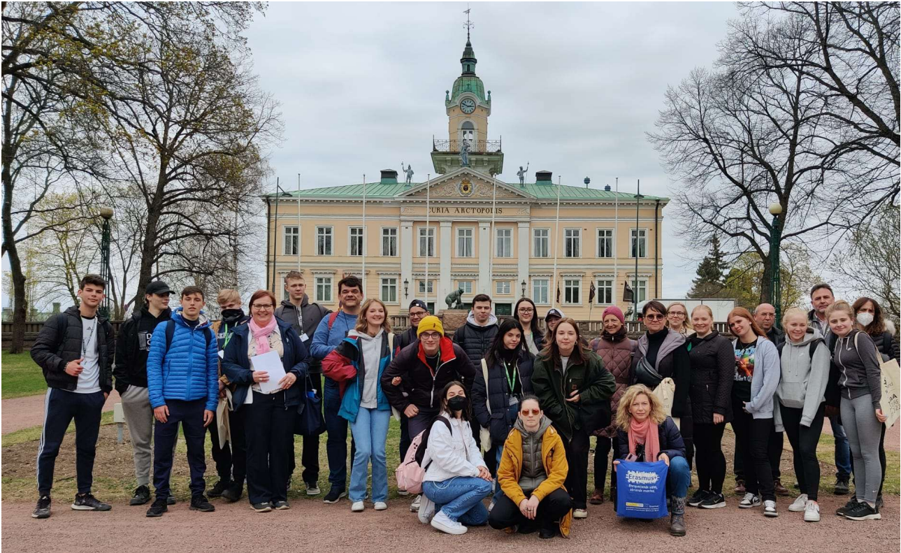
Foto grupal durante el intercambio en Pori (Finlandia) en mayo de 2022