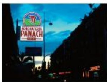
Accèssit - "Tots els cràstia" Berta Boteller Gómez, IES "La Palacona" d'Alboraia