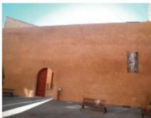
RECONSTRUCTION DU CHÂTEAU

Après, nous avons visité un réservoir ancien chrétien de 1762 qui peut contenir 500.000 l/m 2 . Il y avait des dessins au plafond et un canard qui n'a rien à voir. Quand nous avons fini, nous sommes allés déjeuner au Parc Naturel du Túria. C'est un lieu très grand et protégé. La présence du Túria était partout. Là nous nous sommes réunis les deux groupes.