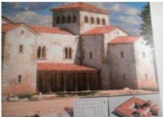
CHÂTEAU DE RIBA-ROJA

Nous nous sommes divisés en deux groupes, nous, le groupe de Plurilingue nous sommes allés au Château de Riba-Roja del Túria, qui a été construit par le comte de Revilla-Gigedo, comme est indiqué à une insigne qui se trouvait là. Nous avons vu aussi comment étaient