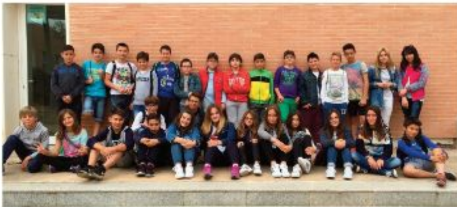
CEIP TOMÀS ALBERT ALBUXECH