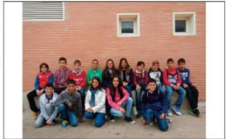
CEIP MARE DE DÉU DEL PATROCINI DE FOIOS