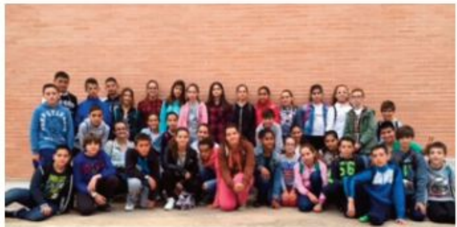
CEIP EL CASTELL ALBALAT DELS SORELLS