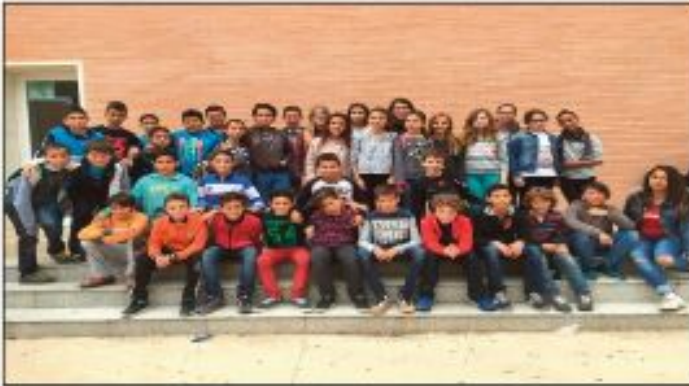
CEIP REI EN JAUME DE FOIOS

BENVINGUDES I BENVINGUTS AL VOSTRE FUTUR CENTRE.