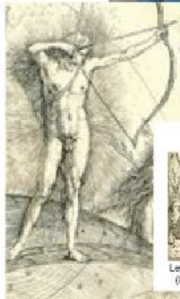
Apol·lo i Diana (Jacopo De'Barbari, 1495-1516)