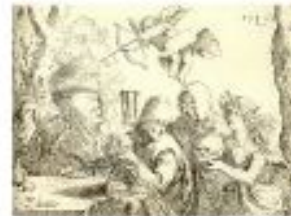
Les edats de l'home i la Mort (Lucas van Leyden, 1523)