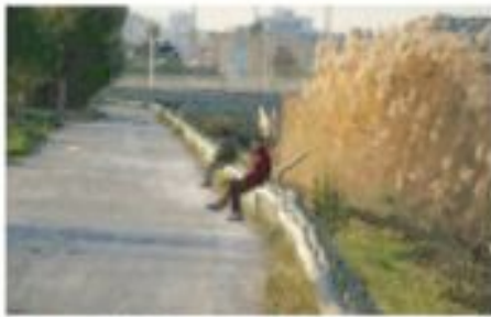
ZnpremiES La Patacona.JPG