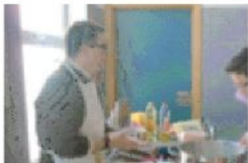
1 o ESO

Les élèves de 1 o et 2 o Eso nous avons préparés des crêpes délicieuses en cours de français et nous nous sommes régalés !