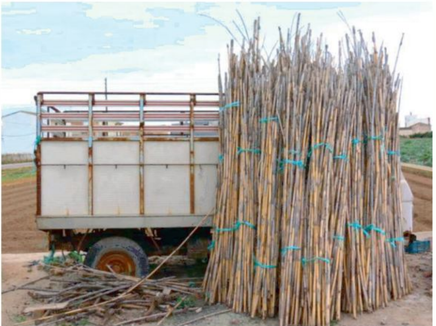
Carles Guillén López 3r ESO Accésit del concurs de fotografia comarcal

LA REVISTA DE L'IES FRANCESC BADIA FOIOS / ALBALAT / ALBUIXECH ABRIL DE 2013