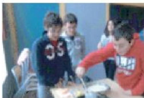
2 o ESO