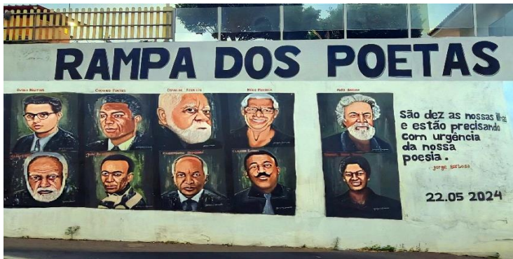
Mural “Rampa dos poetas” a poetas caboverdianos

Murió en 2009 en Praia, y su legado sigue siendo importante en la cultura caboverdiana. En 2024 se le rindió homenaje con un mural en la “Rampa dos Poetas”.