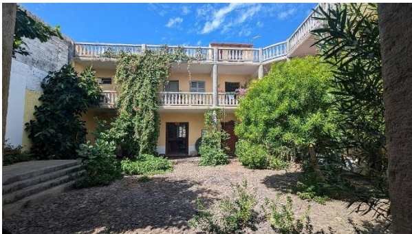
Centro cultural de Montrond