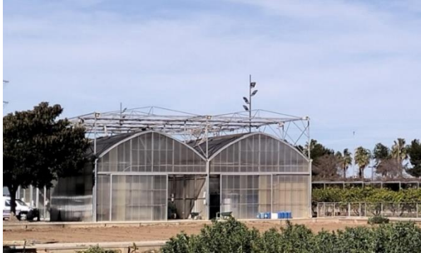
Vista al centro gestor del parque de La Torre