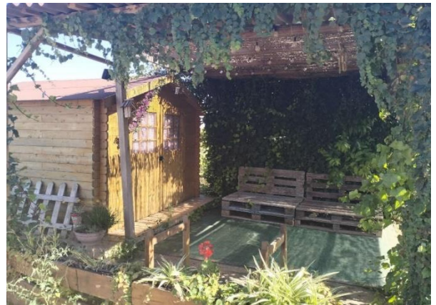
Zonas de descanso