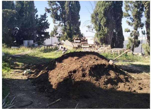
Zona de compostaje