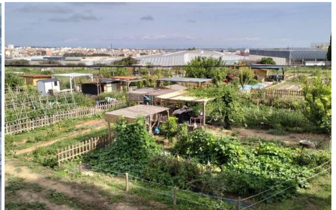
Vista general del huerto