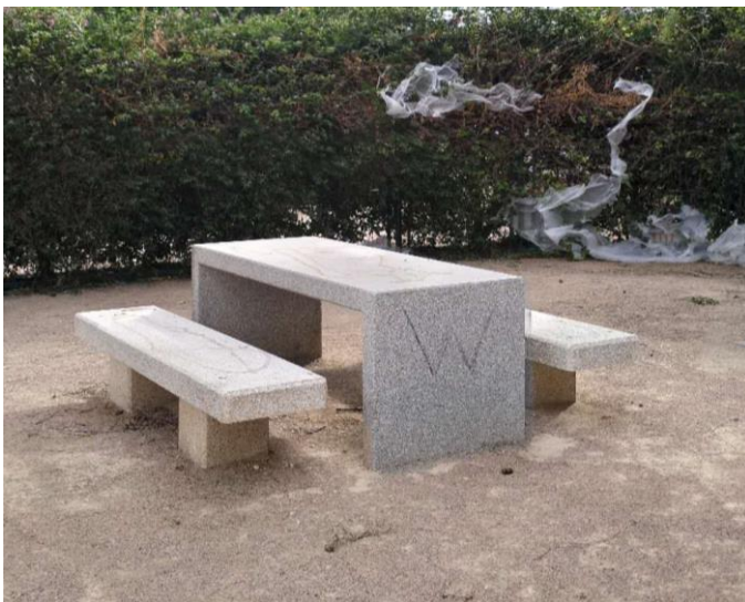
Zona de descanso