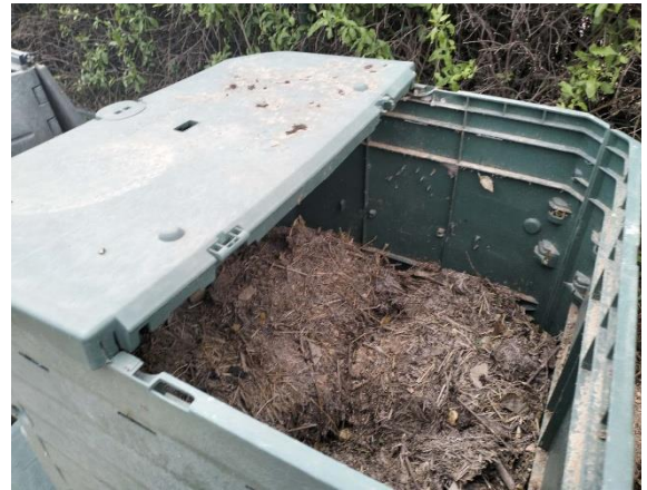
Detalle de las composteras