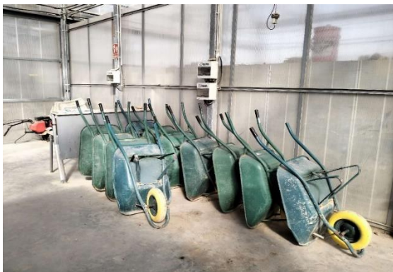
Almacenamiento de carretillas