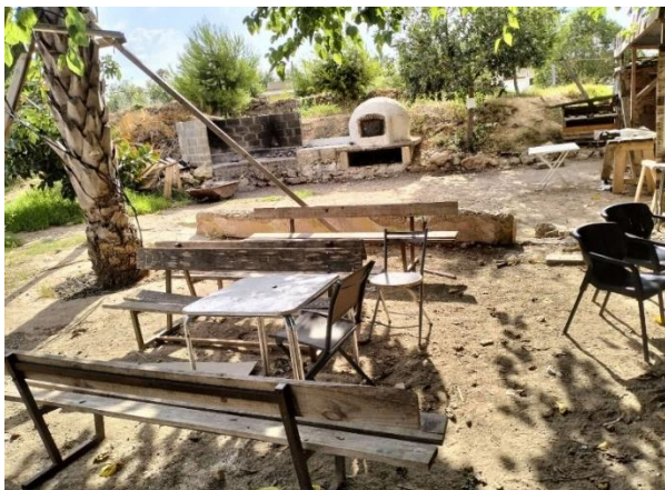
Zona de descanso y de reunión