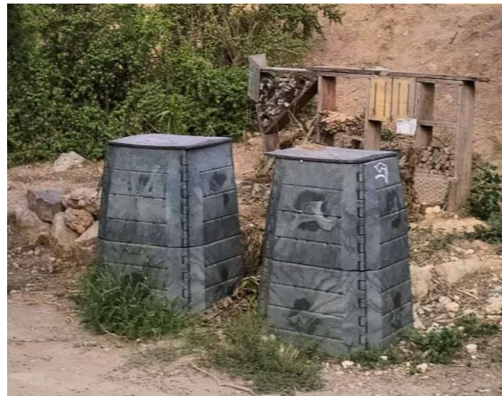
Detalle de las composteras