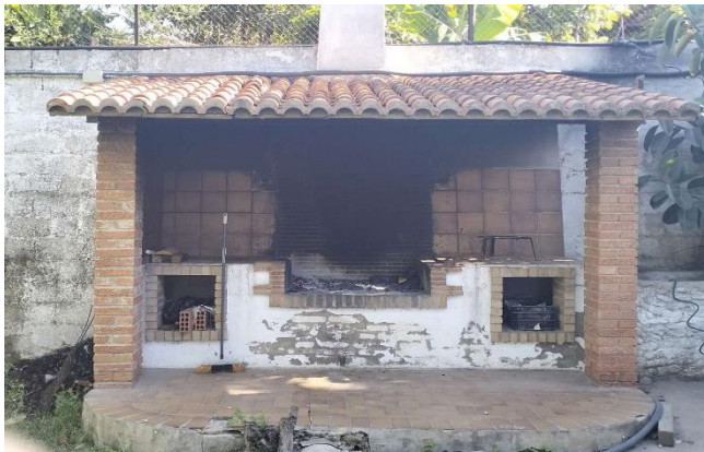
Zona de parrilla