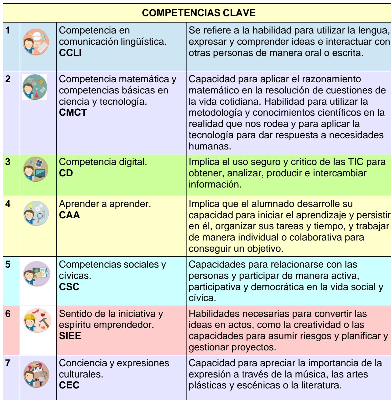
Figura 2: Competencias clave (DeSeCo, 2003)