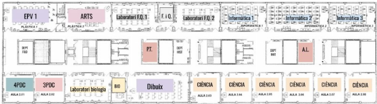
Segona planta 2