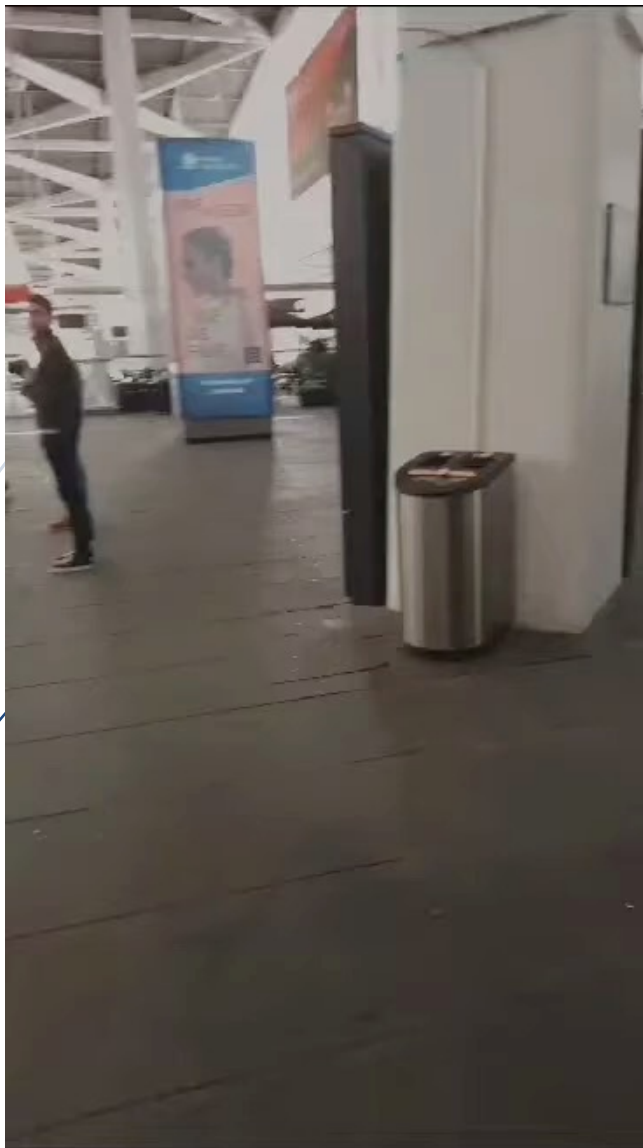
ALMADA, KA121 (GM), 2022-23