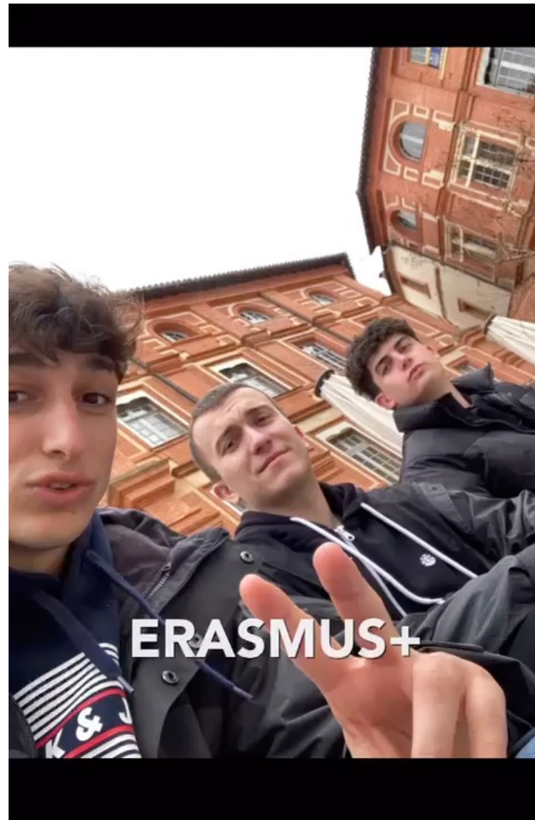
MONTAUBAN, KA131 (GS), 2022-23