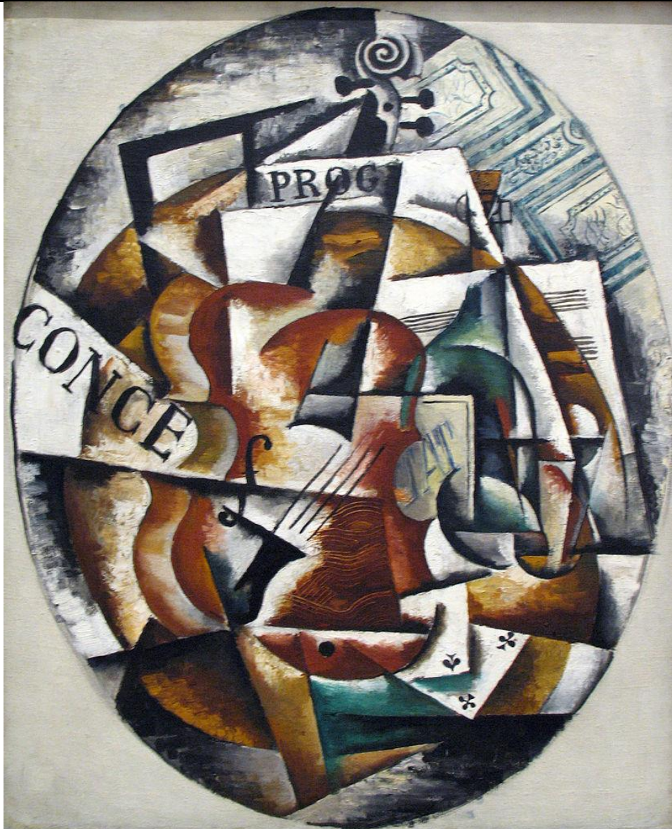
Liubov Popova, "Violí", 1915