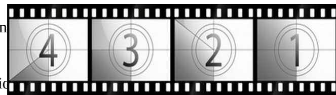
Edició de vídeo