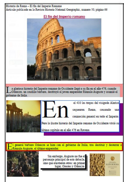
Disseny avançat de textos