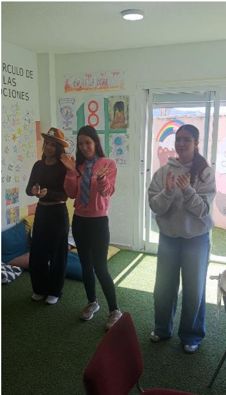
AULA UET, TALLER HABILITATS SOCILAS I COMUNICACIÓ A TRAVÉS DEL TEATRE I L'ACTUACIÓ SESSIÓ 7