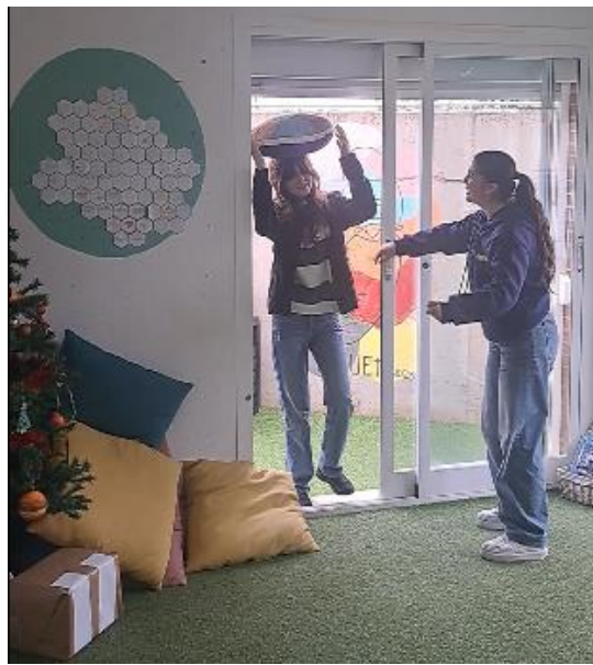
AULA UET, TALLER HABILITATS SOCILAS I COMUNICACIÓ A TRAVÉS DEL TEATRE I L'ACTUACIÓ SESSIÓ 2

Finalment, es va proposar la creació d'escenes grupals en què l'objecte esdevingué l'eix central. Els participants van construir tres o quatre escenes diferents, on l'expressió corporal i sonora de l'elenc donava vida a diverses interpretacions i narratives al voltant del mateix element.