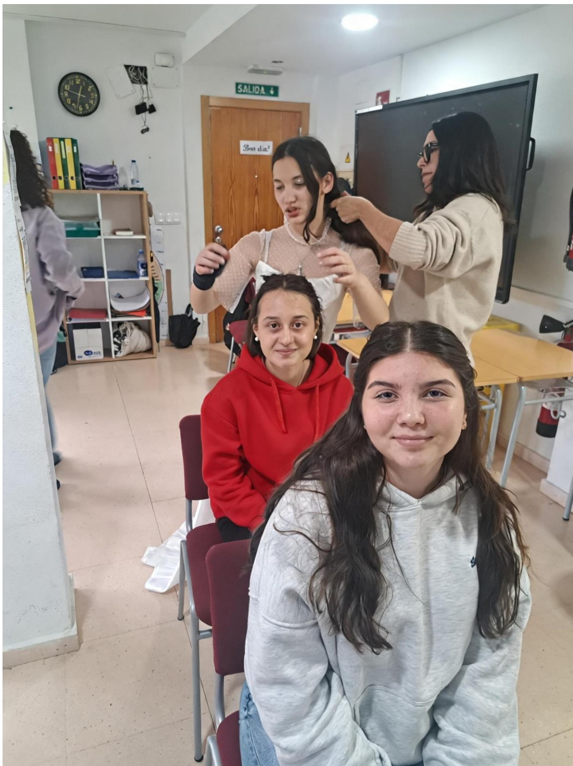
AULA UET, TALLER HABILITATS SOCILAS I COMUNICACIÓ A TRAVÉS DEL TEATRE I L'ACTUACIÓ SESSIÓ 11