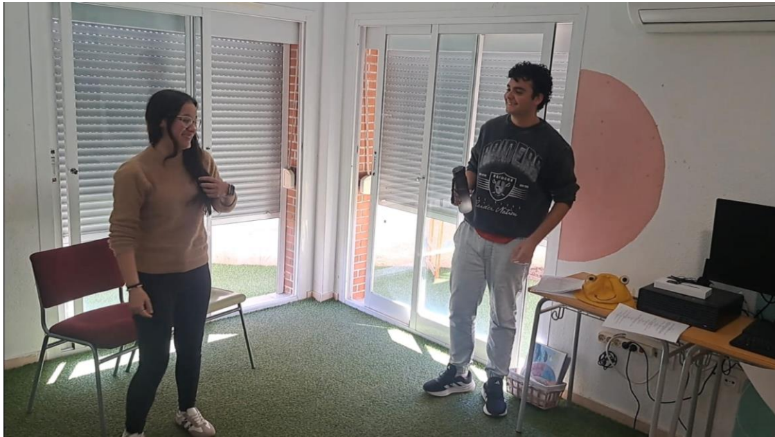
AULA UET, TALLER HABILITATS SOCILAS I COMUNICACIÓ A TRAVÉS DEL TEATRE I L'ACTUACIÓ SESSIÓ 9