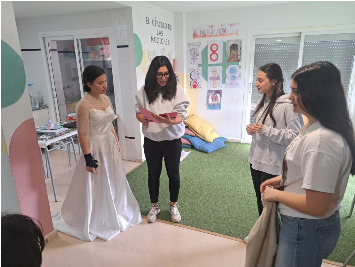
AULA UET, TALLER HABILITATS SOCILAS I COMUNICACIÓ A TRAVÉS DEL TEATRE I L'ACTUACIÓ SESSIÓ 10