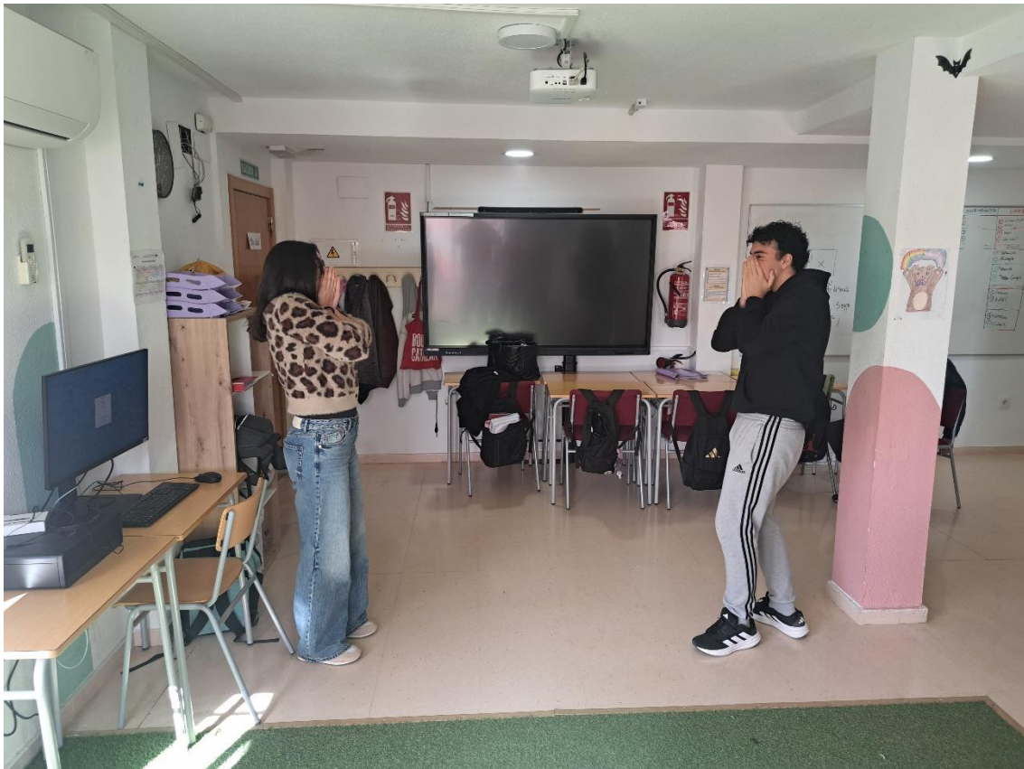
AULA UET, TALLER HABILITATS SOCILAS I COMUNICACIÓ A TRAVÉS DEL TEATRE I L'ACTUACIÓ SESSIÓ 6

A través d'estes activitats es va pretendre integrar l'expressió corporal amb la dimensió emocional i narrativa del personatge.