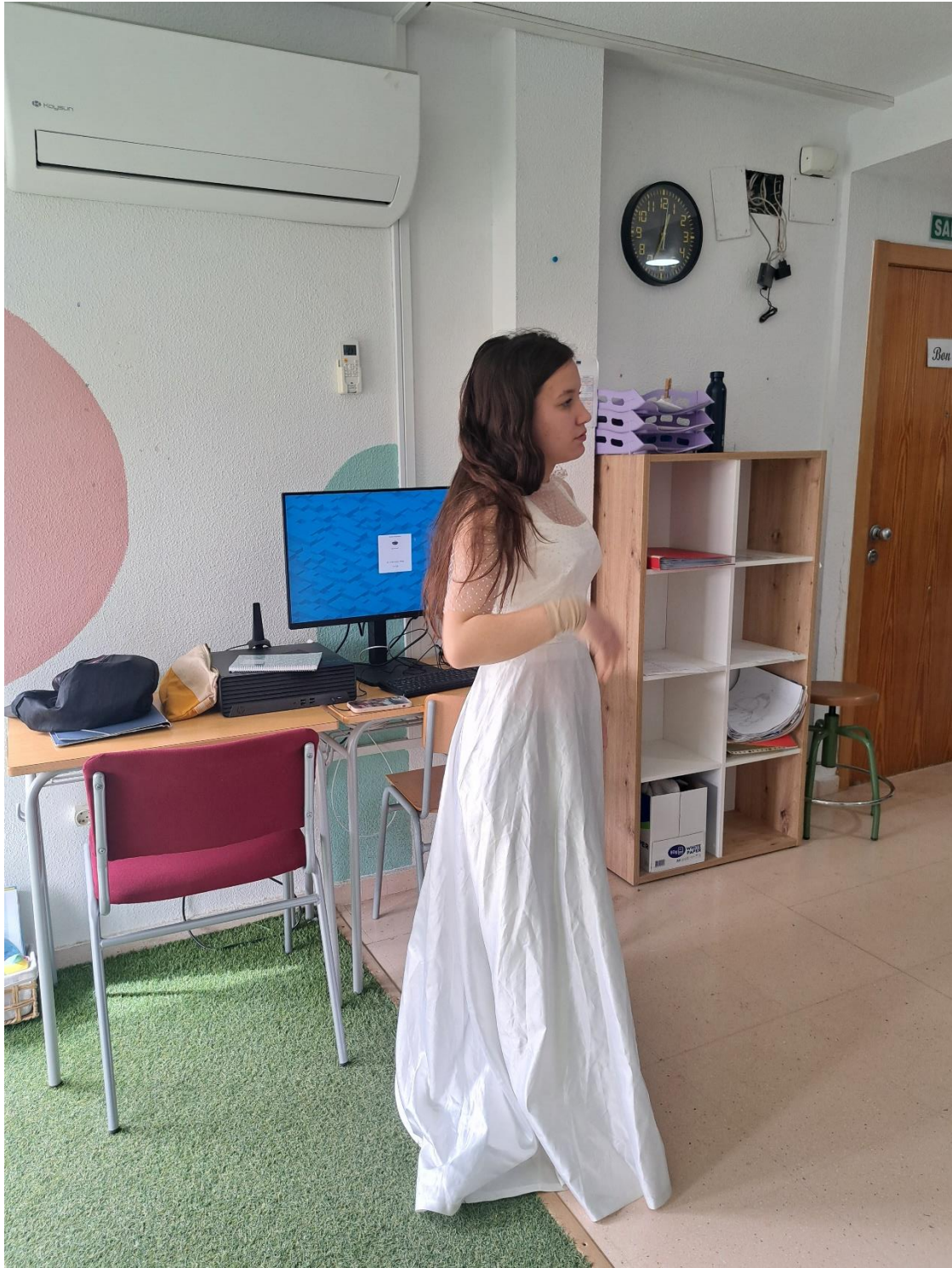
AULA UET, TALLER HABILITATS SOCILAS I COMUNICACIÓ A TRAVÉS DEL TEATRE I L'ACTUACIÓ SESSIÓ 11