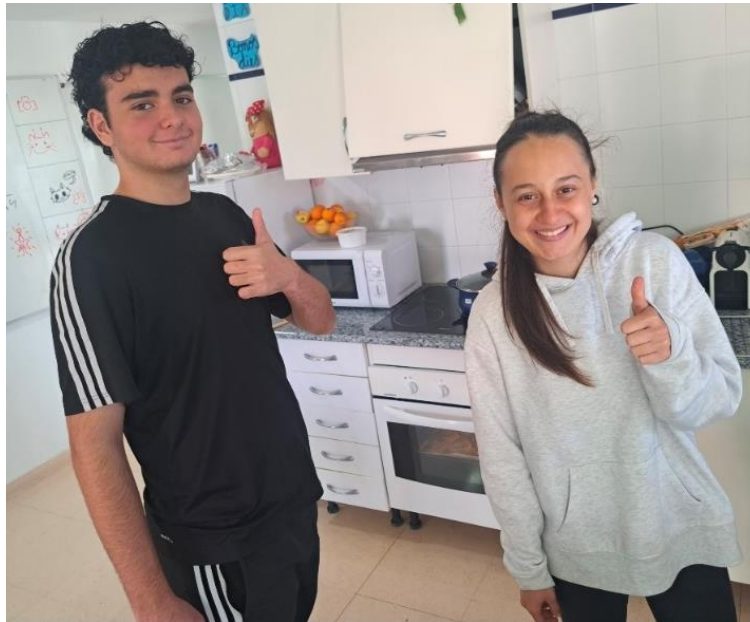
AULA UET, TALLER HABILITATS SOCILAS I COMUNICACIÓ A TRAVÉS DEL TEATRE I L'ACTUACIÓ SESSIÓ 3