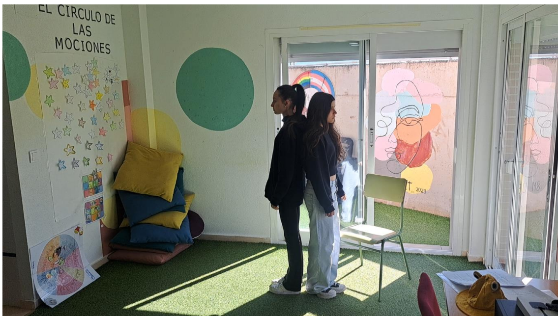
AULA UET, TALLER HABILITATS SOCIALS I COMUNICACIÓ A TRAVÉS DEL TEATRE I L'ACTUACIÓ SESSIÓ 5

La sessió va culminar amb improvisacions grupals en què l'alumnat va aplicar estos personatges físics en diferents situacions proposades, afavorint la interacció, la creativitat i l'adaptació a contextos variats.