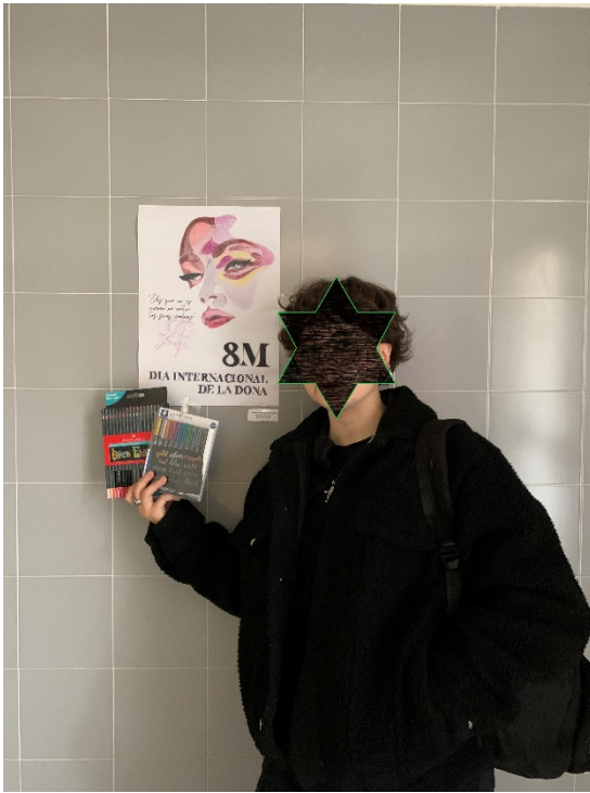
Il·lustració 8: Concurs cartell dia de la Dona