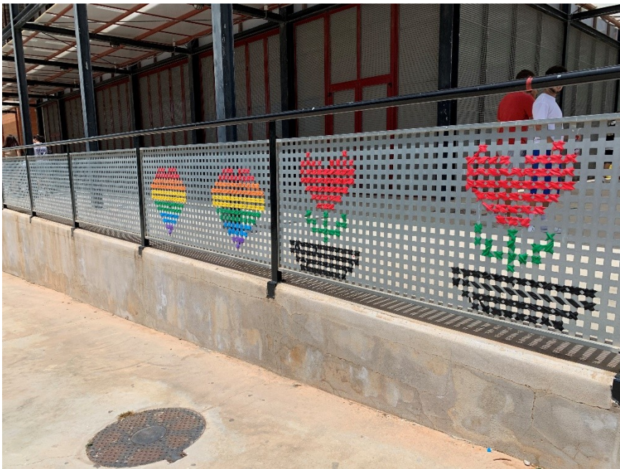
Il·lustració 9: Punt de creu per la Diversitat