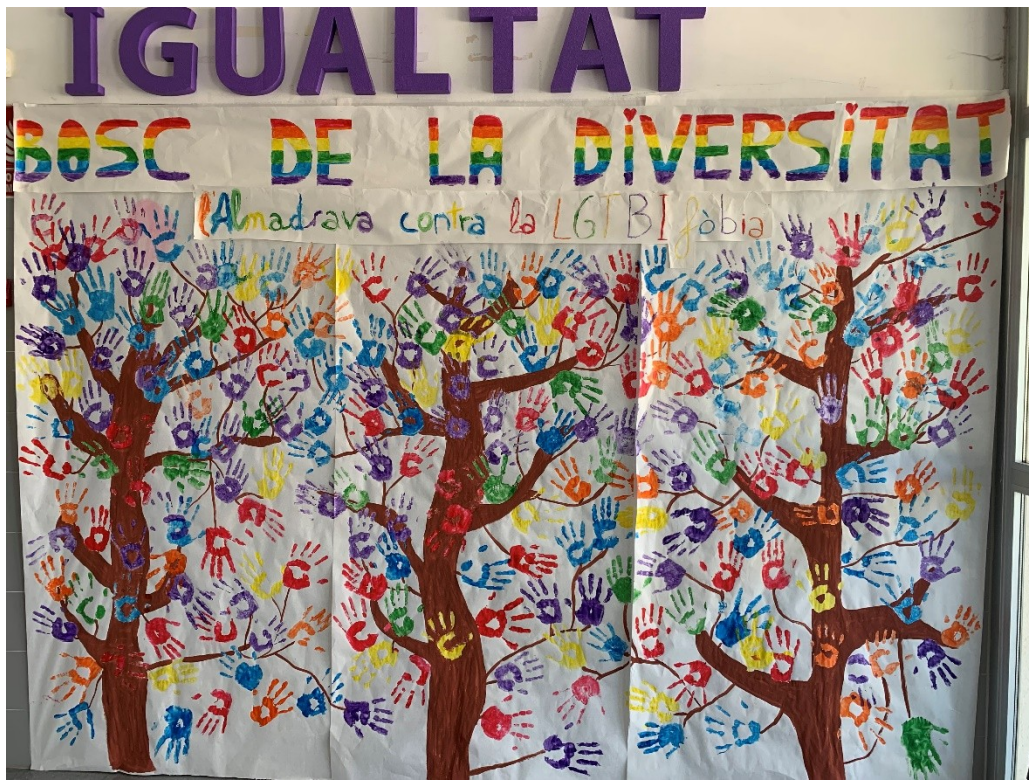
Il·lustració 6: Bosc de la Diversitat