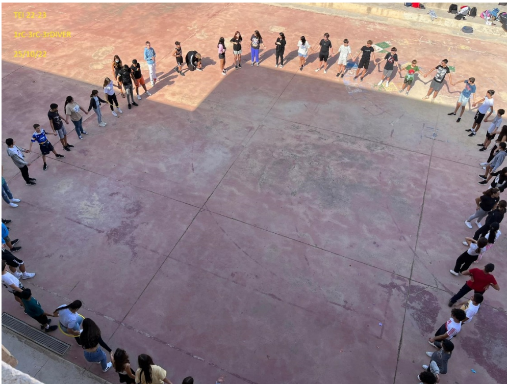
Il·lustració 1: activitat TEI