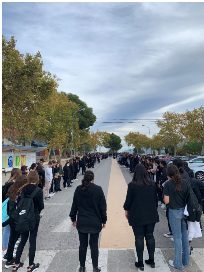
Il·lustració 2: Cadena humana 25 N