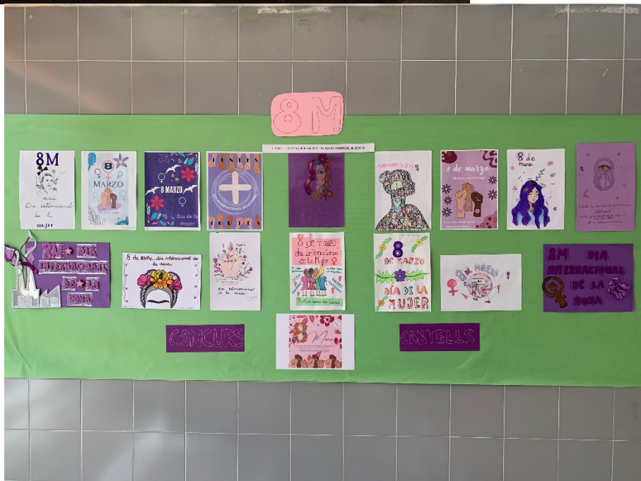
Il·lustració 4: Cartells dia de la dona