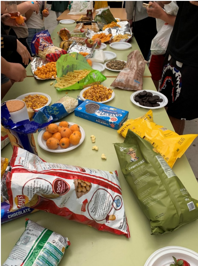
Il·lustració 5: Esmorzar TEI