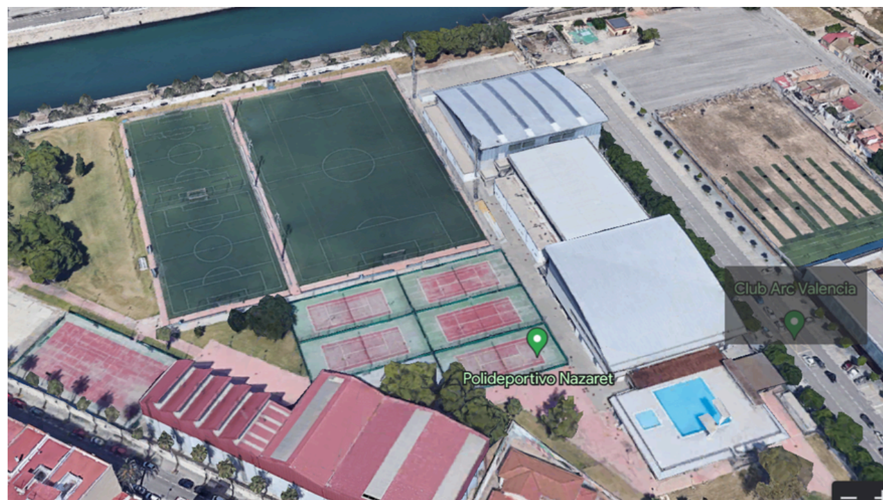
Polideportivo de Nazaret (Valencia)

C/Fernando Morais de la Horra, s/n, 46024 València, Valencia