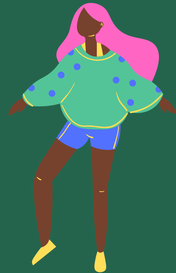
ASIGNATURAS 1º BACHILLERATO LOMLOE