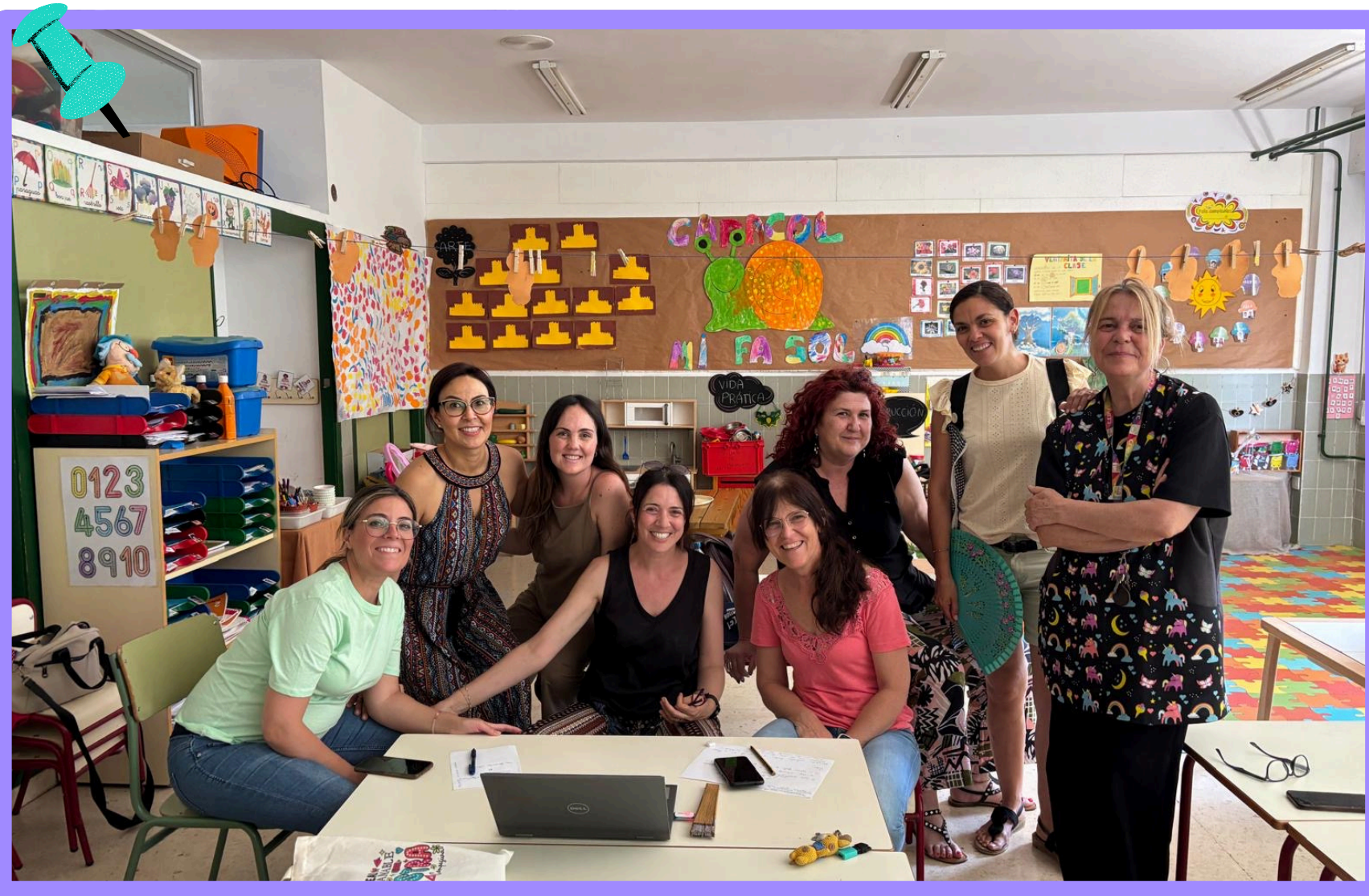
Equipo docente de E.I.