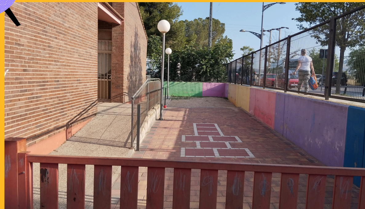
ENTRADA ESPACIOS AL AIRE LIBRE