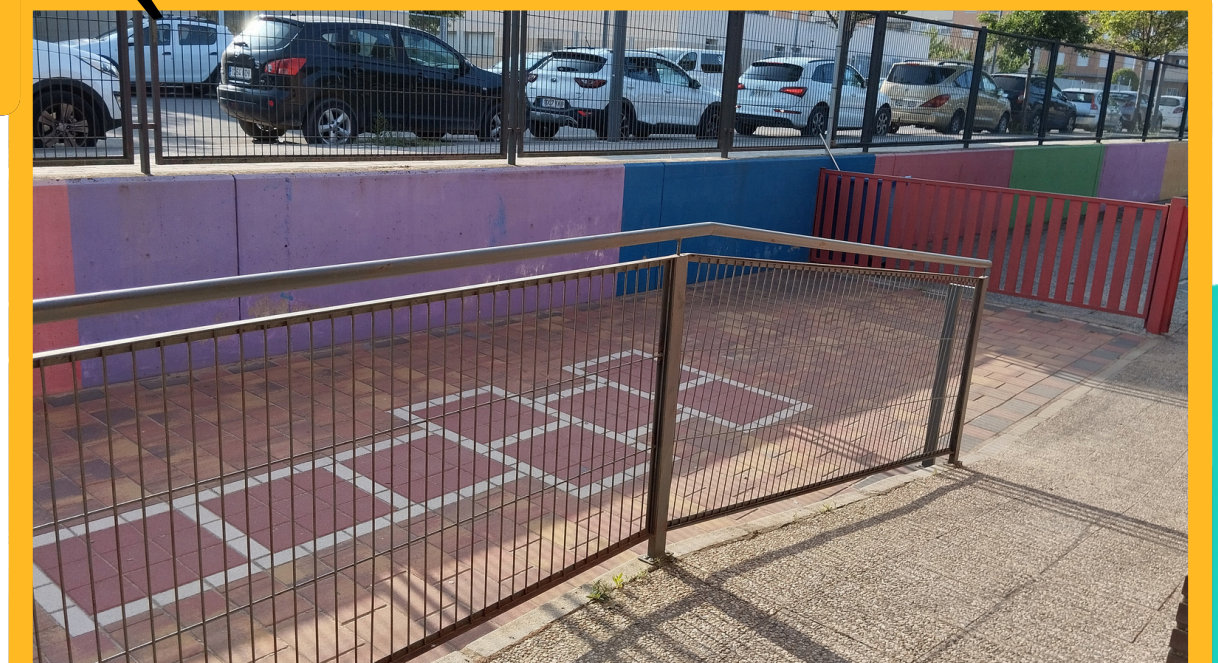
ZONA DE LA ENTRADA