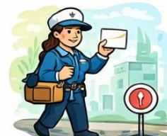
el carter, la cartèra