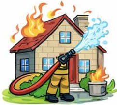
el bomber la bombera