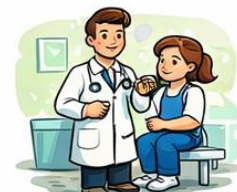
el metge la metgessa