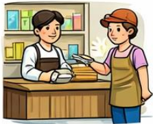
el dependent la dependenta