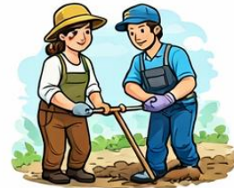
el llaurador la llauradora