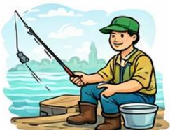
el pescador la pescadora