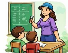
la mestra el mestre