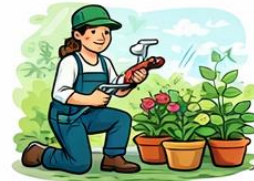
el mecànic la mecànica