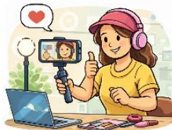
el creador de contingut la creadora de contingut