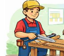
el fuster la fustera