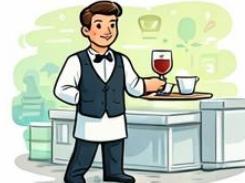
el cambrer la cambra