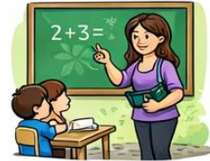
el mestre la mestra