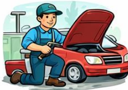
el llanterner la llanternera