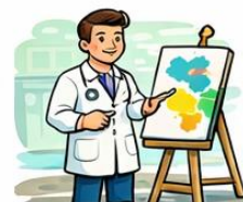
el pintor la pintora