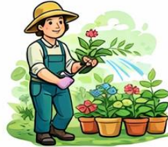
el jardiner la jardinera