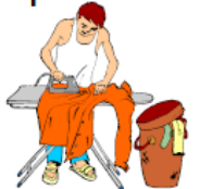
amo de casa mestressa de casa