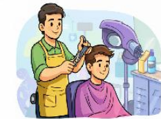
el perruquer la perruquera