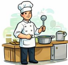
el cuiner la cuinera