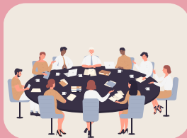
EQUIPO DIRECTIVO DEL CENTRO