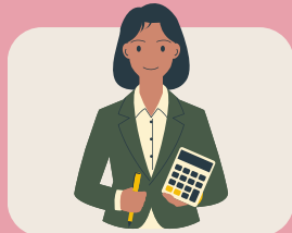
REPRESENTANTES DE LAS EMPRESAS