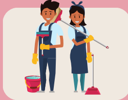
ADMINISTRACIÓN Y SERVICIOS