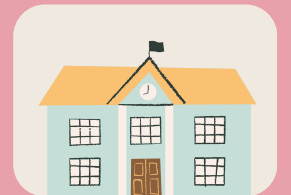
REPRESENTACIÓN DEL AYUNTAMIENTO