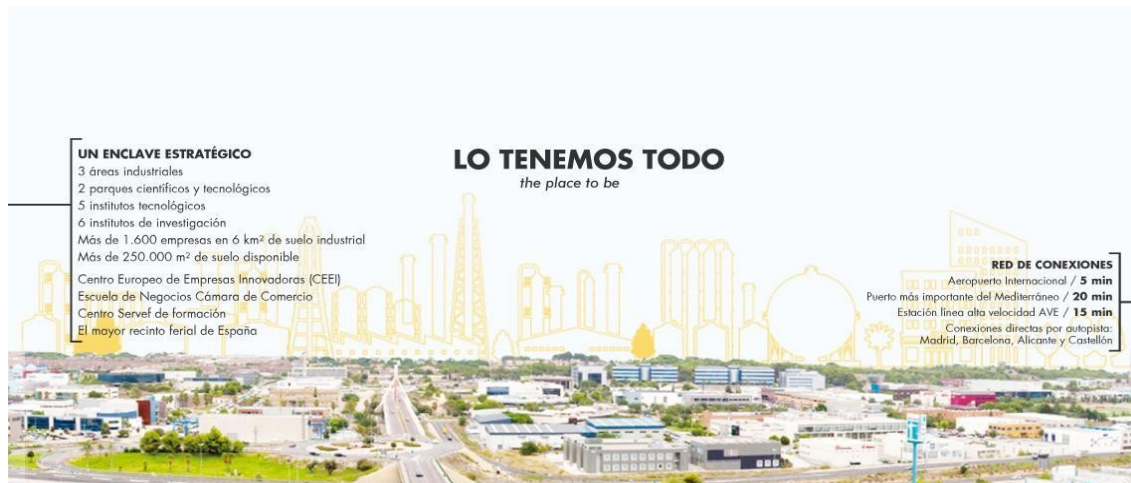
Publicitat de l'Ajuntament de Paterna sobre el seu teixit industrial.

al costat de Font del Gerro, el Parc Tecnològic de València en el nord del municipi, dedicat a empreses d'alta tecnologia, I+D i centres d'investigació; el Parc Científic, el Polígon Sector 9 L'Andana i el Polígon Municipal, al costat de Tàctica. La producció industrial és molt diversificada: alimentació, fusta, productes metàl·lics, construcció de maquinària, manufacturats de matèries plàstiques, paper, cuir, etc.