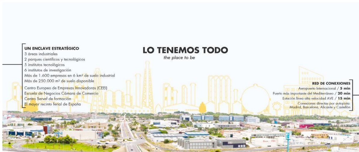
Publicitat de l'Ajuntament de Paterna sobre el seu teixit industrial.

Paterna destaca especialment per l'activitat industrial. En el municipi de Paterna s'enclava una de les principals àrees industrials de la Comunitat Valenciana, estant el 14% del terme municipal ocupat per zones industrials. La proximitat a València, les bones vies de comunicació i l'existència de sòl abundant van propiciar la creació d'aquestes àrees, per a descongestionar les zones industrials de la capital. El Polígon Industrial Font del Gerro es troba enclavat en el centre del municipi, al costat de la A-7 i la CV-365 i travessat per la línia 2 del metre de València; 1 el Parc Empresarial Tàctica al costat de Font del Gerro, el Parc Tecnològic de València al nord del municipi, dedicat a empreses d'alta tecnologia, I+D i centres d'investigació; el Parc Científic, el Polígon Sector 9 L'Andana i el Polígon Municipal, al costat de Tàctica. La producció industrial és molt diversificada: alimentació, fusta, productes metàl·lics, construcció de maquinària, manufacturats de matèries plàstiques, paper, cuir, etc.