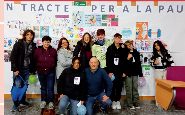
XX Trobades d'alumnat mediador de l'IES Benlliure (18-12-2023)