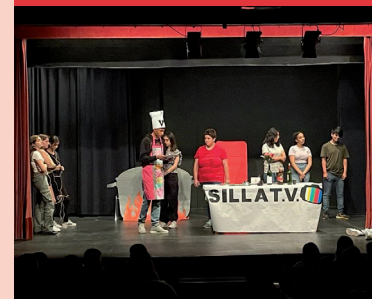
Teatre per la convivència. Visita a les escoles (5-5-2023)