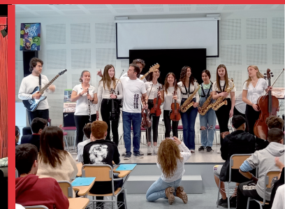
VIII Jornades sobre Convivència: Grup de cambra del Conservatori de Silla (3-4-2023)