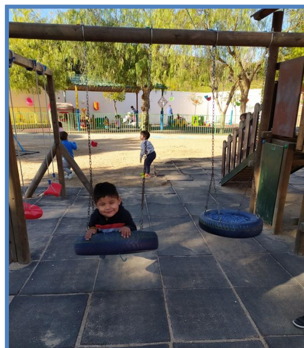
ESTRUCTURA MADERA PATIO ALUMNOS 2 AÑOS