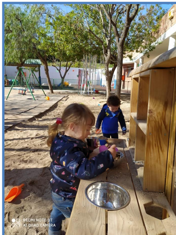
AMBIENTE SÍMBOLICO. COCINA PATIO 2 AÑOS