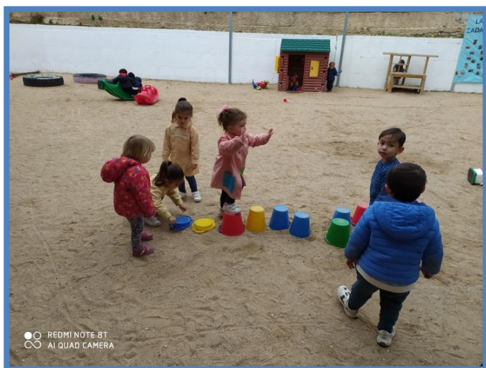
PATIO ALUMNOS 2 AÑOS