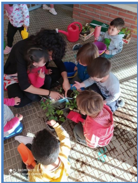
ACTIVIDAD CORRALITO AULA 2 AÑOS. HUERTO

Si por cualquier motivo falta personal para vigilar los patios, el tiempo de almuerzo se reducirá teniendo en cuenta que prima en bienestar y seguridad de nuestros alumnos/as.