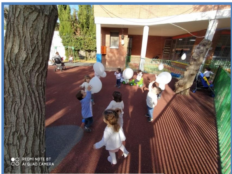
PATIO ALUMNOS 1 AÑO