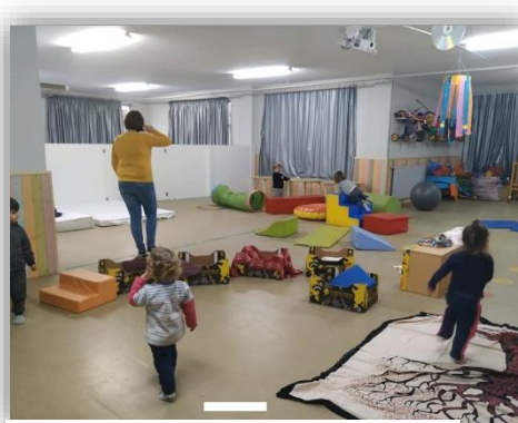
AULA MULTIUSOS PSICOMOTRICIDAD