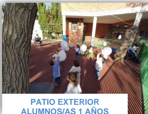
PATIO EXTERIOR ALUMNOS/AS 1 AÑOS