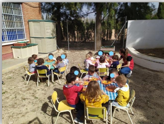
APROVECHAMOS EL ESPACIO EXTERIOR DEL COLE