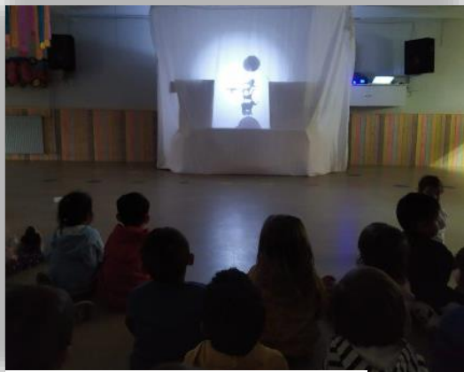
FOMENTO A LA LECTURA FAMILIA-ESCUELA