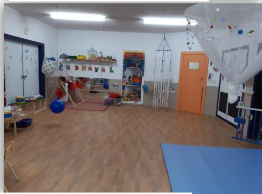
AULA ALUMNOS/AS 1 AÑOS