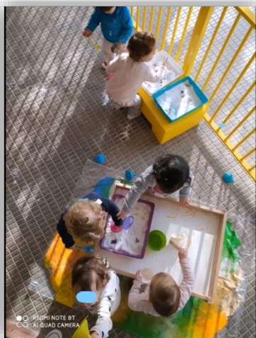
ACTIVIDAD TRASVASE CORRALITO DE LA