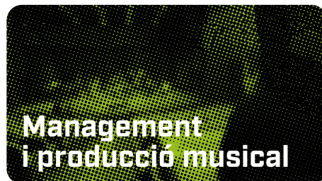
Producció i gestió musical