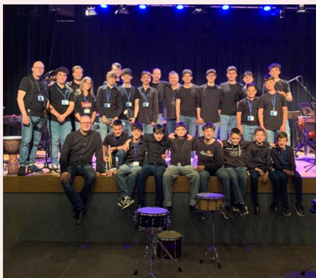
Intercentres Percussió a Villena - 11 d'abril