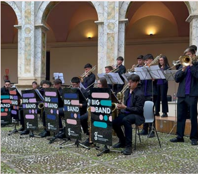
La Big Band Gomis, a Xàtiva