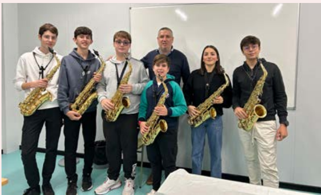
Alumnat de saxo.- 25N a l'IES l'Estació