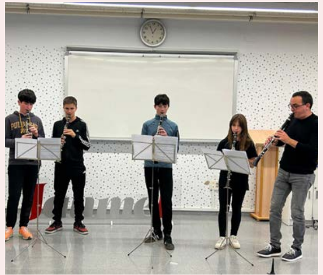
L'alumnat de clarinet del IES Jaume I interprenen amb el seu professor