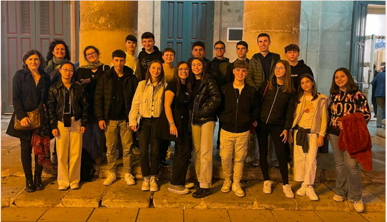
Al teatre Principal d'Alacant a escoltar el Quartet Casals