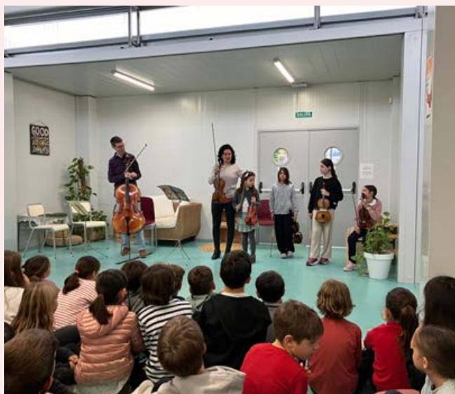
Concert per a escolars de l'alumnat i professorat de Corda