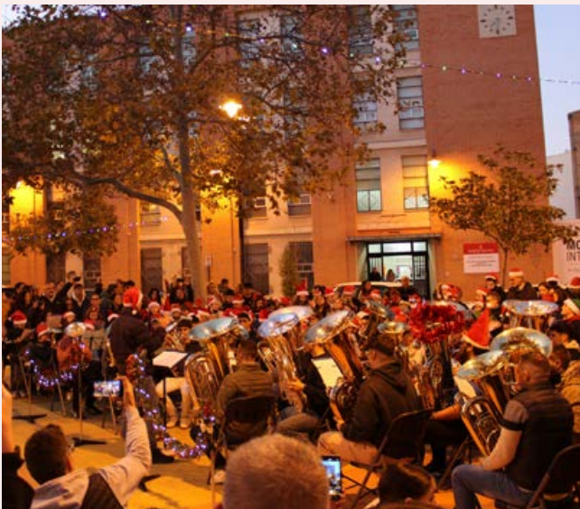
NadalTubes, amb l'alumnat del Conservatori de Cullera