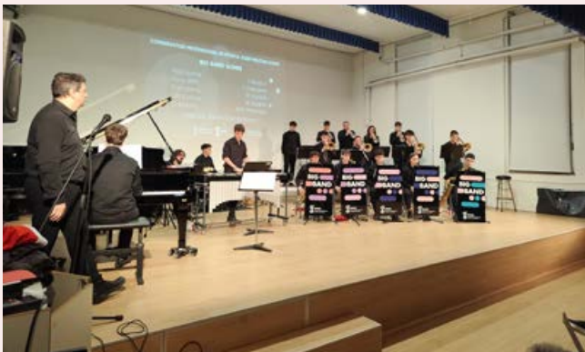
Big Band- concert de Nadal