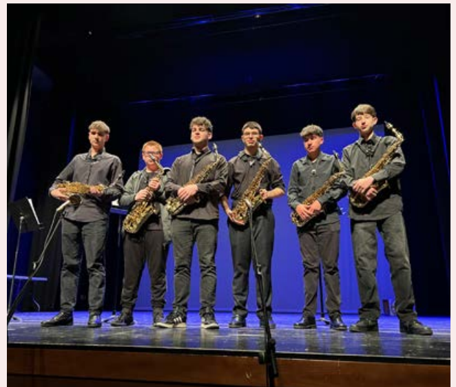
Col·laboració de l'aula de saxos a l'IES Jaume I - 15 d'abril