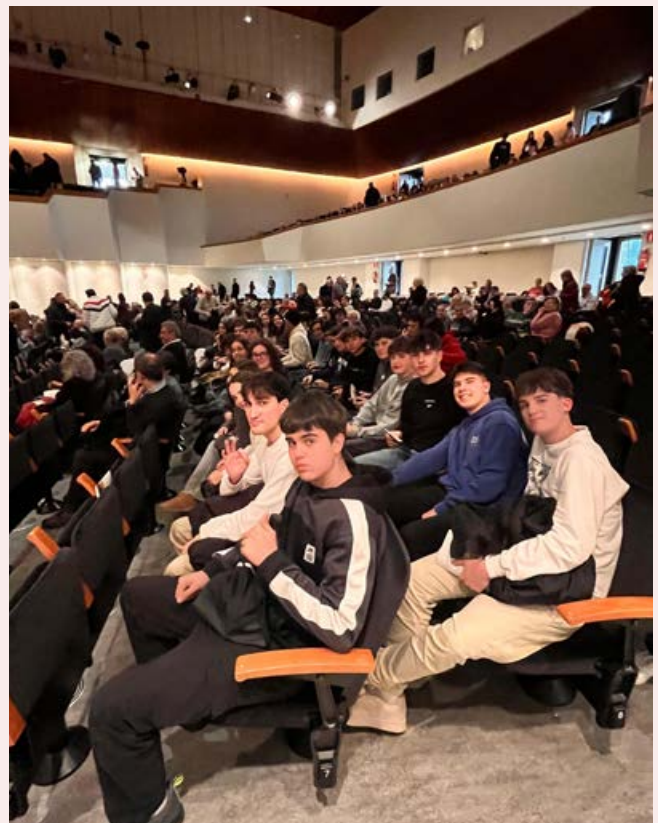
Alumnat a la representació de la 9ª de Beethoven al Palau de la Música