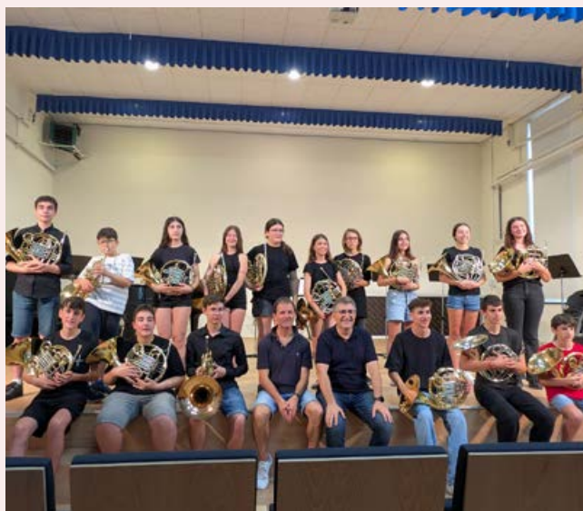
Ensemble de trompes en el concert de final de curs