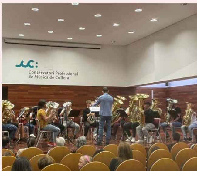
Intercanvi de tubes amb el Conservatori de Cullera