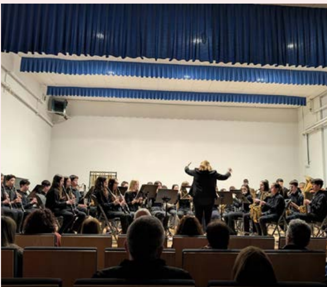
Banda 1r i 2n