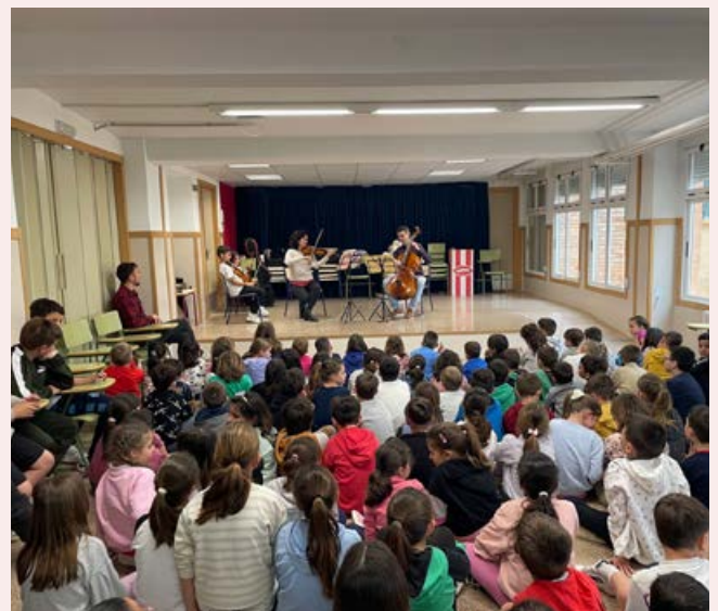
Concert per a escolars de l'alumnat i professorat de Corda