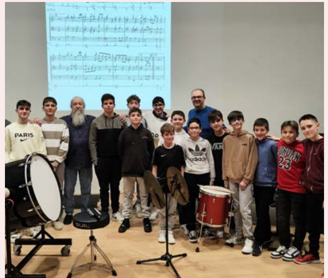
Classe Magistral de Percussió amb Pedro Estevan