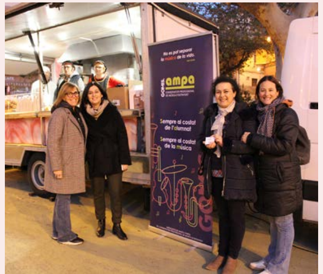
NadalTubes, xocolatà col·laboració de l'AMPA