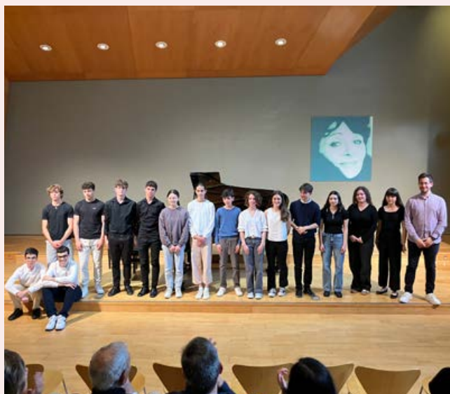
Intercanvi de piano amb el Conservatori de San Cugat del Vallés