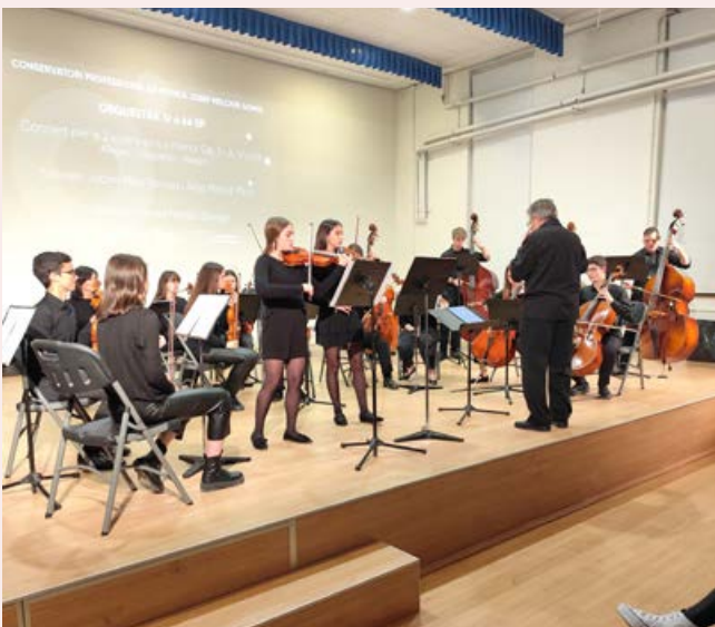
Concert de l'orquestra al 1r trimestre