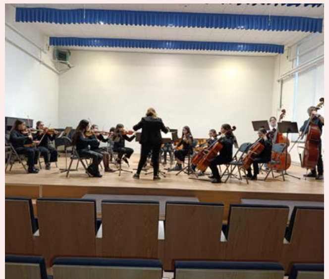
Orquestra 1r i 2n