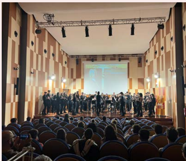
Intercanvi de clarinet amb el Conservatori d'Elda