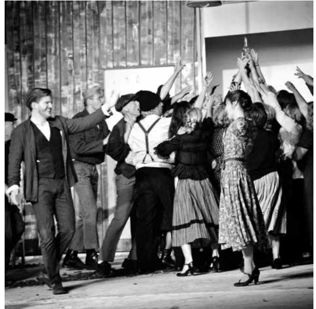
Nemorino en L'elisir d'amore.

Desde la infancia siempre me ha gustado la música, en especial cantar. Desde los coros, pasando por la música pop, los boleros, el jazz, el barbershop, el musical, la zarzuela, etc; el canto siempre ha formado parte de mi vida (y de la de mi familia, por parte de mi padre, cantante también) en todas sus variantes. No obstante, la ópera no vino hasta bastante tarde, no me lo planteé seriamente hasta pasados los 20 años, cuando empezamos a ir de excursión al Palau de les Arts. Recuerdo que vimos muchas óperas y conciertos con cantantes de primera línea. Tosca, de G. Puccini, me marcó.