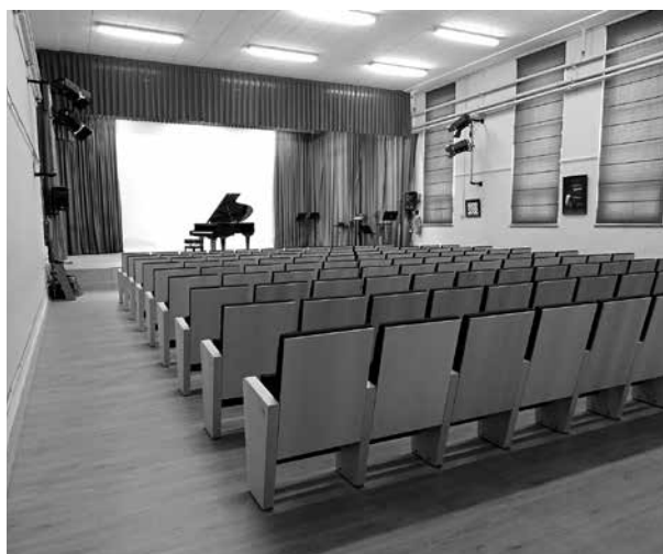
Evolució de l'Auditori des dels anys 60 fins a l'actualitat