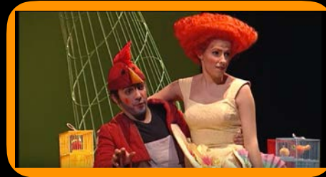
La petita Flauta Màgica. Teatre del Liceu Música. Teatre. Primària