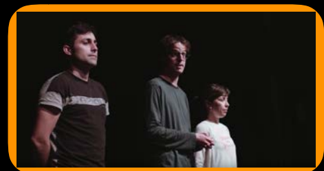
Com quedem?. Teatre de Caixó Teatre fòrum. ESO / BATXILLERAT