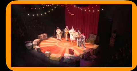
Rhum.Monti i cia. Teatre. Circ Familiar