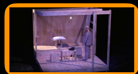
Mon pare és un ogre Cia La Baldufa Teatre. Familiar