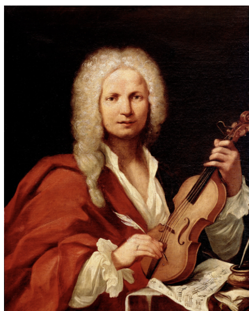
Vivaldi, uno de los compositores con más piezas para oboe.

En cuanto a su compositor favorito para piezas de oboe, me ha comentado que tendría que pertenecer al barroco ya que fue la época dorada del oboe. Hay muchas obras, pero de las que él considera favoritas y de compositores que tengan varias piezas para oboe serían Vivaldi, Telemann o Haendel. Después, durante el periodo clásico, también hay varios compositores que le gustan como es el caso de Lebrun, que además de componer también era oboísta. Y también me ha comentado que había compositores que componían para otros instrumentos, pero también ocasionalmente para el oboe;