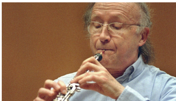
Heinz Holliger tocando el oboe.