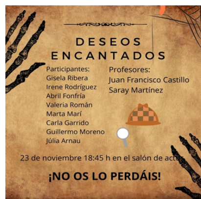
Cartells dels projectes realitzats pels alumnes de 1r i 2n d' EE PP.

Piano, literatura i dansa? I per què no? Cada cop són més els concerts de música en què s'introdueixen un altre tipus d'arts, i com a músics és positiu obrir-nos a nous camins. A més, tenim alumnes que fan un altre tipus d'activitats a banda dels estudis del conservatori. En aquest cas, dues de les nostres alumnes també fan dansa, així que van aprofitar l'oportunitat perquè posessin en pràctica allò que van aprendre en altres centres.