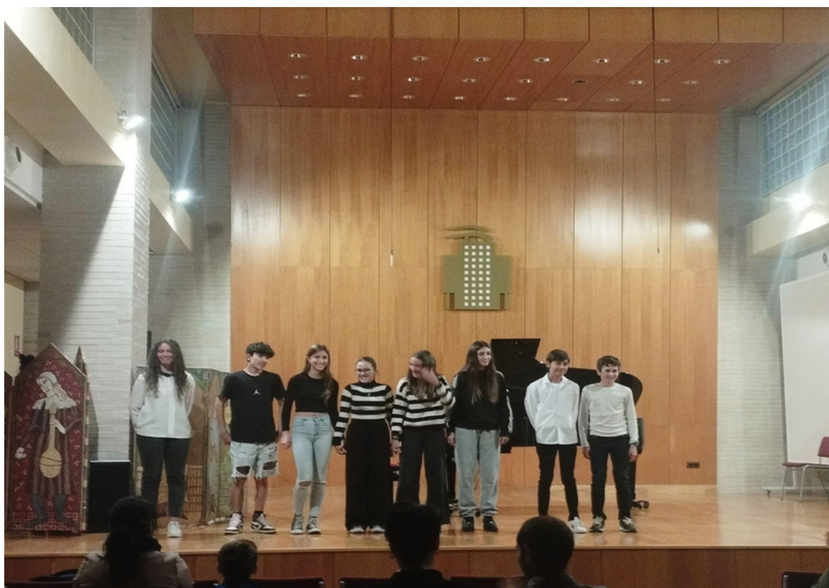
Alumnes de 2n d' EE PP al finalitzar la història narrada amb piano.