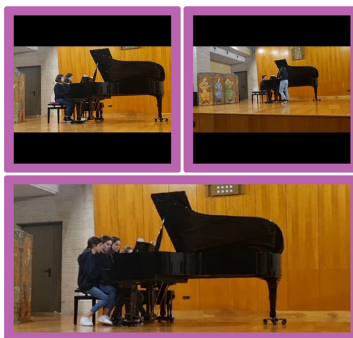
Alumnes de 1r EE PP durant l'actuació.

“Y desde ese instante nada volvió a ser igual.” I així és com s'acaba la narració de l'espectacle de 2n d'EE PP. Desitgem que res no sigui igual que ahir, que la música dels nostres alumnes sigui nova, fresca, viva, que puguin transmetre-la d'una manera diferent a les persones, i acostin la música des de diferents perspectives per poder arribar a la gent. En resum, que puguin gaudir de la bellesa de l'art i de la unió de la música i els músics.