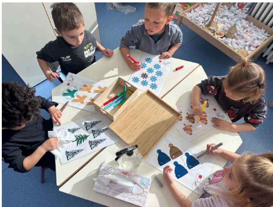
Encuentra el diferente