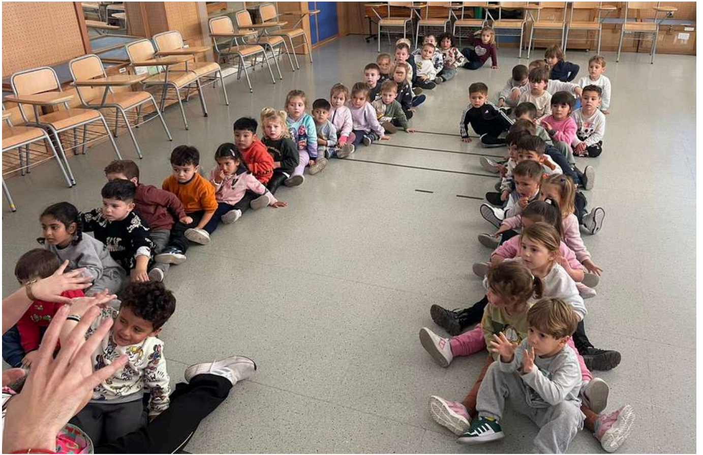
Finalizamos la sesión con un momento de masajes, favoreciendo la relajación y el disfrute compartido