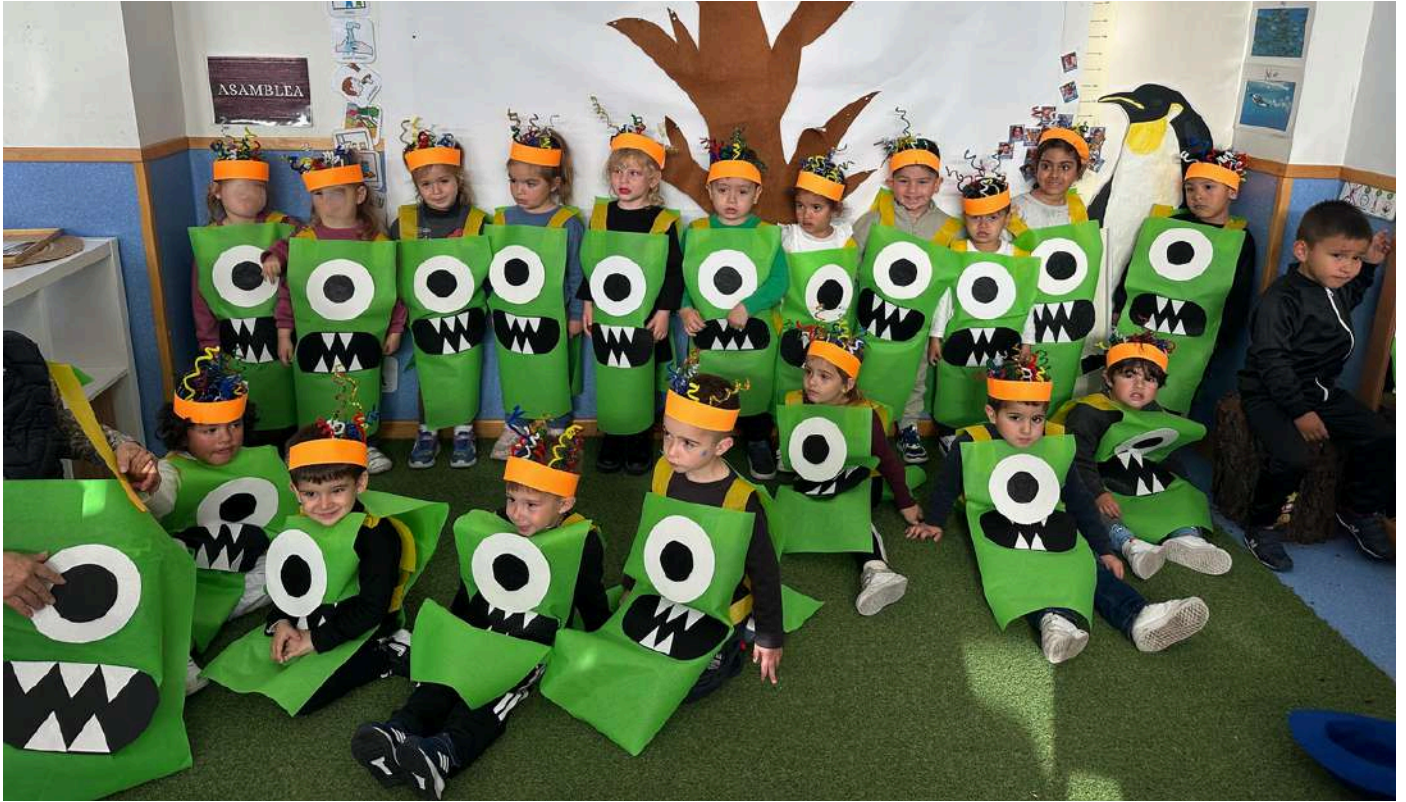
DISFRAZ DEL COLE