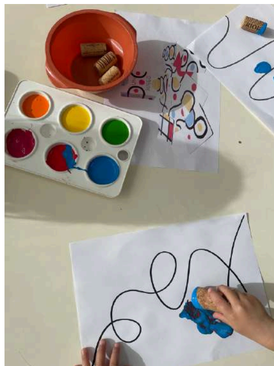
Arte con Hervé Tullet