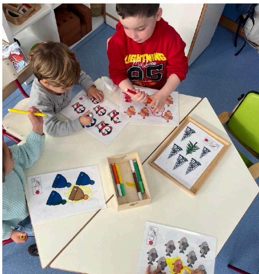
Encuentra el diferente