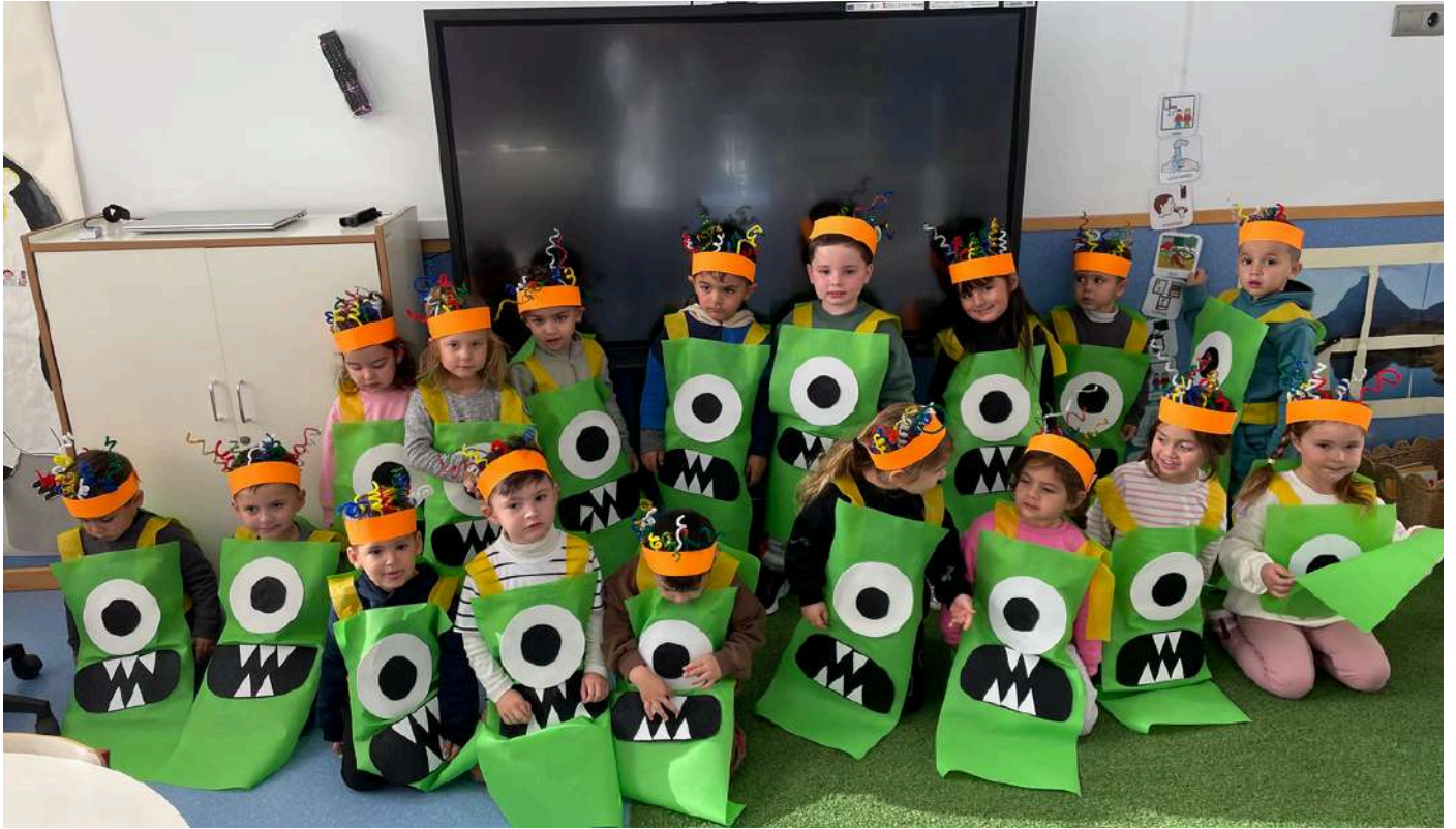
DISFRAZ DEL COLE