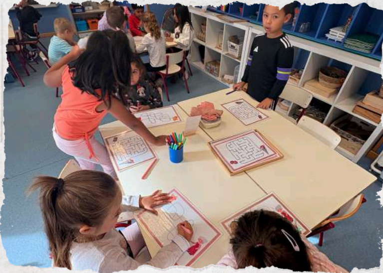
Teacher and Joint Bookroom