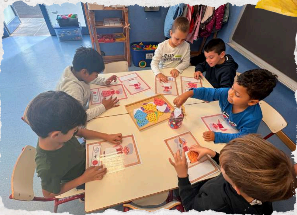
Teacher and Joint Bookroom