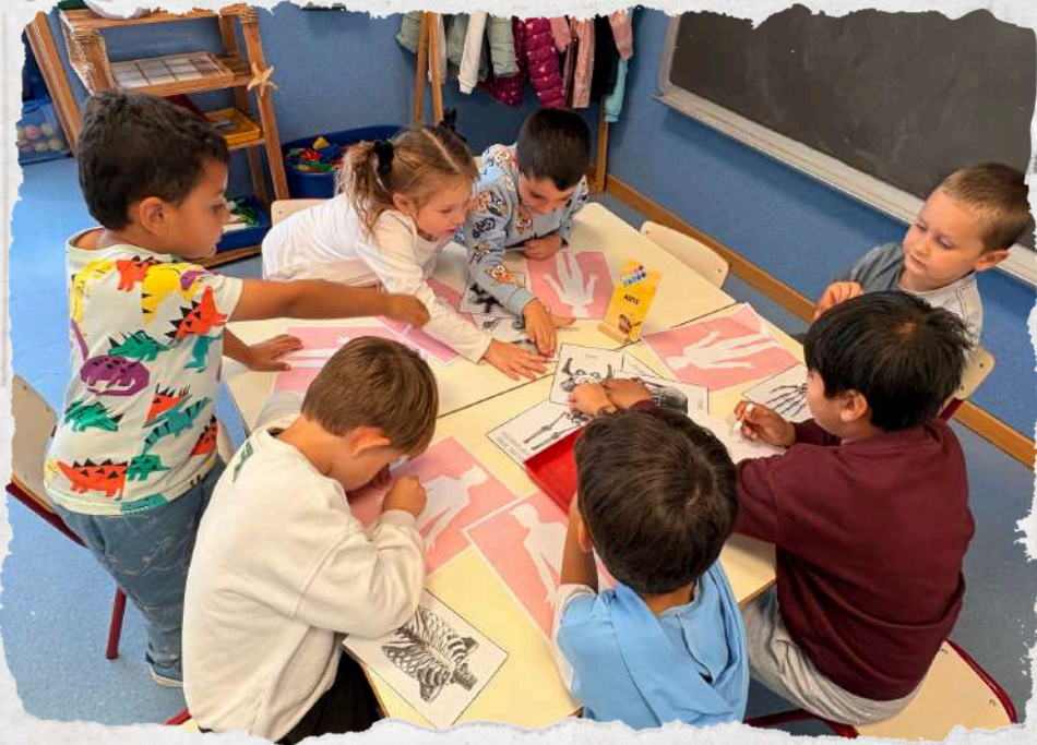
erwriter and Joint Bookrunner