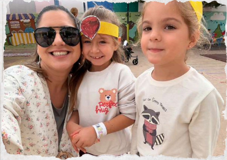
Teacher Writer and Joint Bookrunner