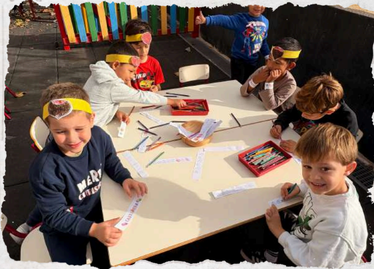
Teacher Writer and Joint Bookrunner