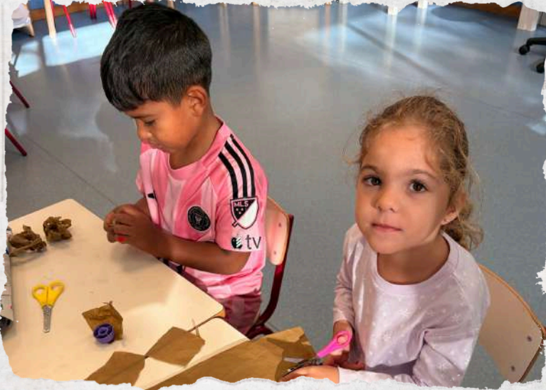
Teacher Writer and Joint Bookmaking