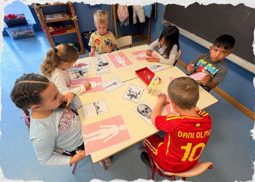
erwriter and Joint Bookrunner