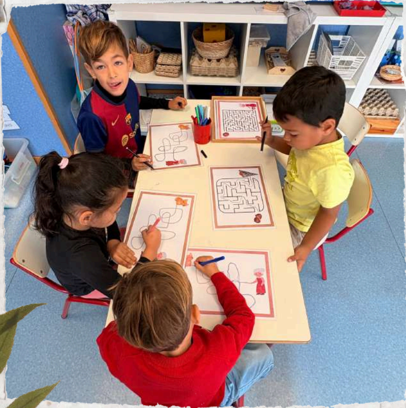
Teacher Writer and Joint Bookmaking