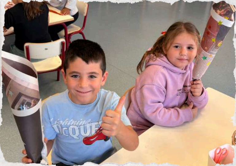
Teacher Writer and Joint Bookmaking