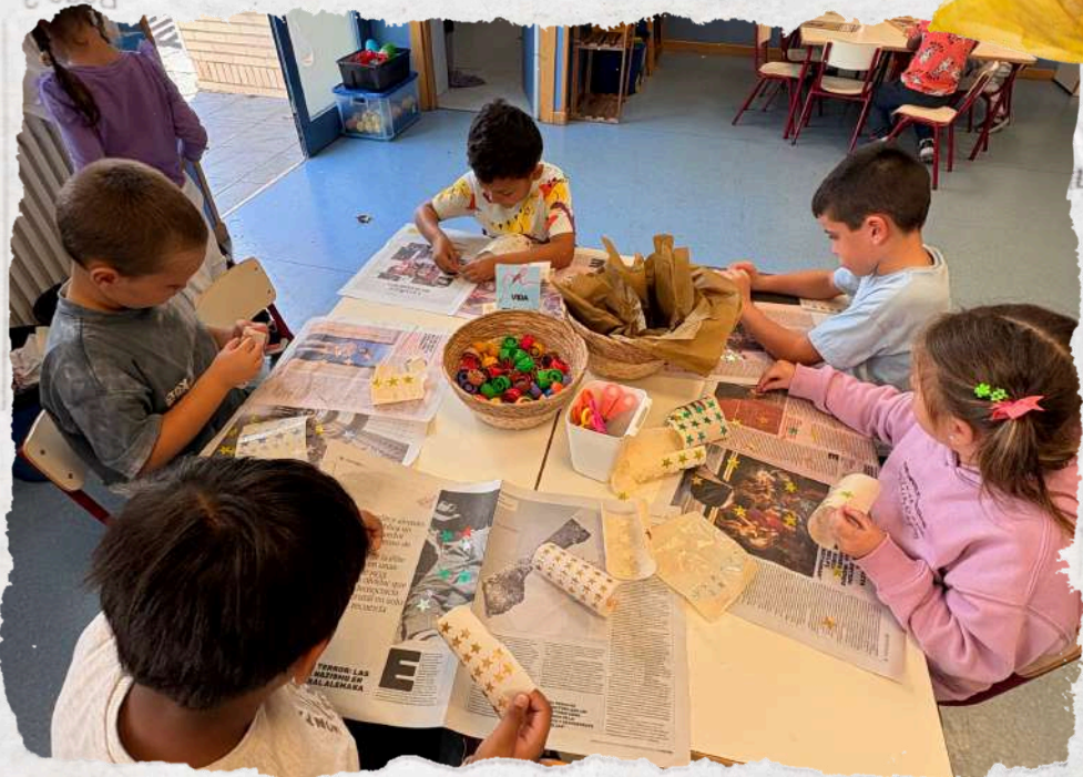
Teacher Writer and Joint Bookmaking