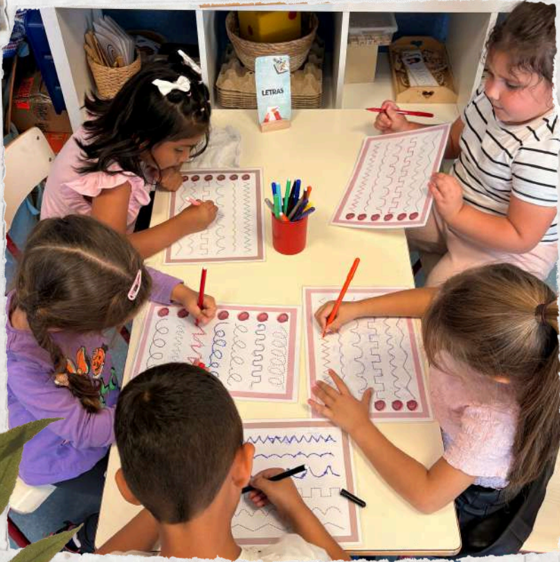
Teacher Writer and Joint Bookmaking