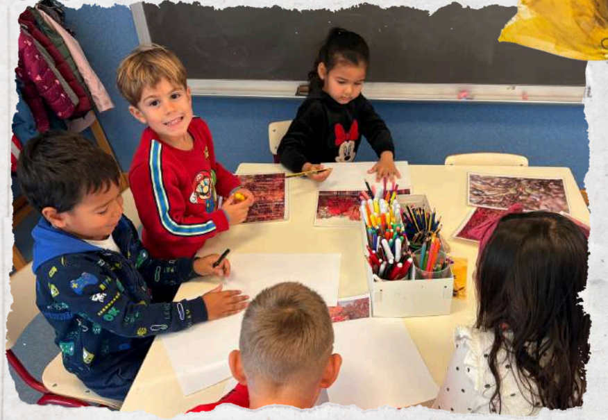
erwriter and Joint Bookrunner