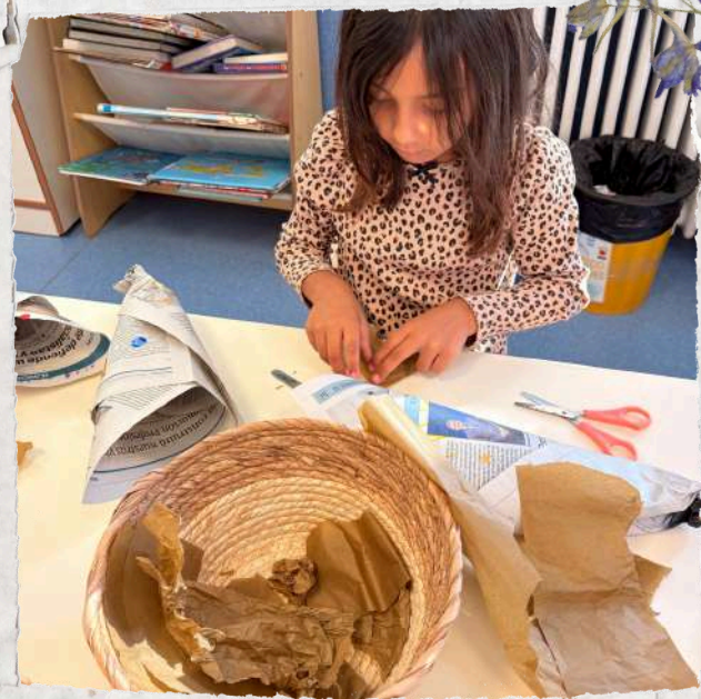
Teacher Writer and Joint Bookmaking