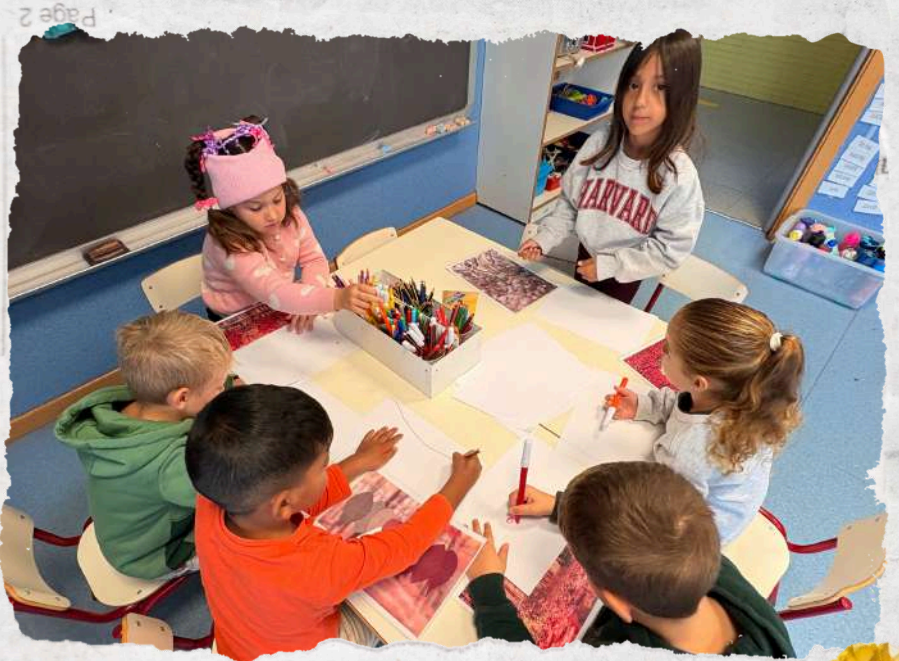
and Joint Bookrunner