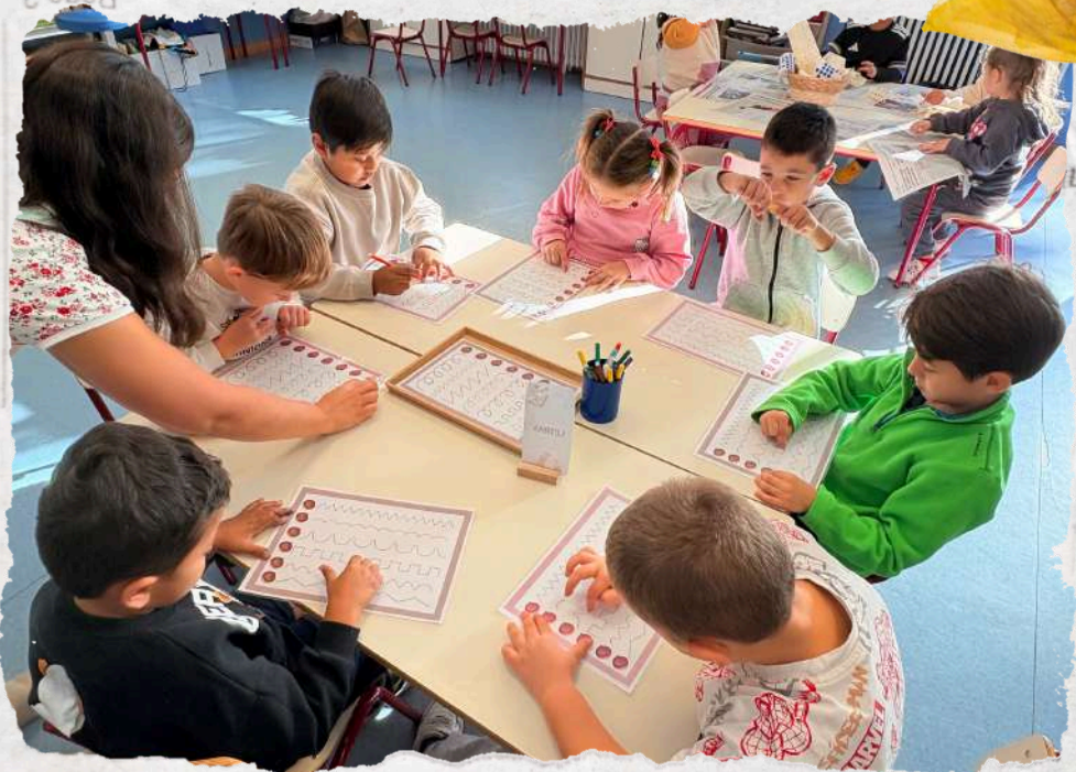
Teacher Writer and Joint Bookmaking