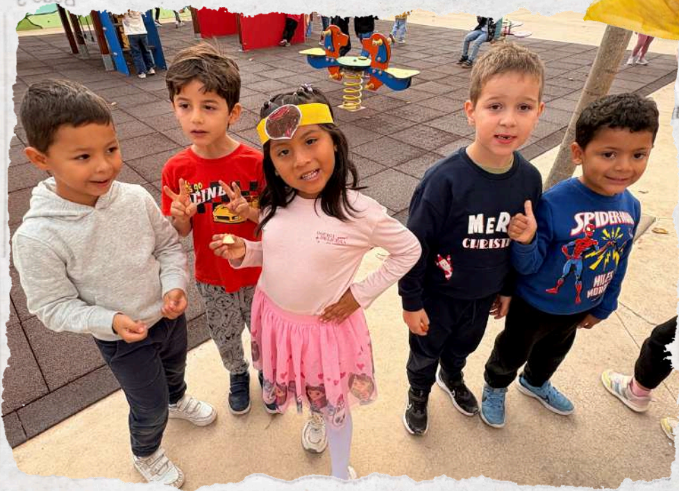
Teacher Writer and Joint Bookrunner