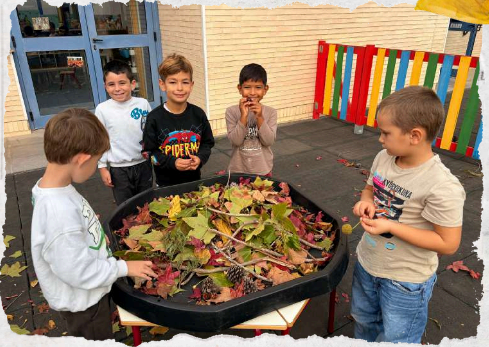
Teacher Writer and Joint Bookrunner