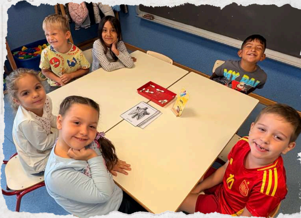
erwriter and Joint Bookrunner