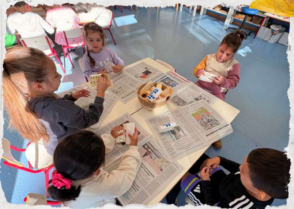
Teacher Writer and Joint Bookmaking