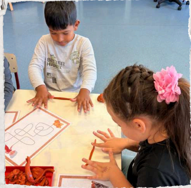
Teacher Writer and Joint Bookmaking