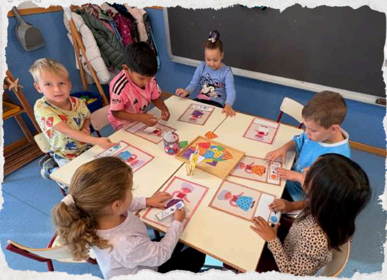
Teacher Writer and Joint Bookmaking