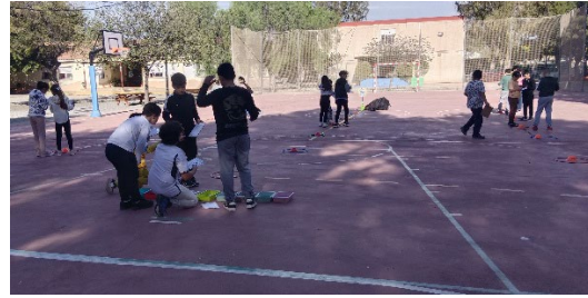
Foto 6. El alumnado trabajando de forma autónoma.

Finalmente, se abordó la simbología propia de los mapas de orientación y se practicaron dos modalidades del propio deporte: la modalidad de O-pie y la modalidad de score.