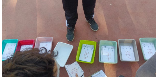
Foto 5. Los diferentes recorridos multinivel a elegir por el alumnado.