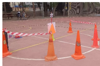
Foto 8. Montaje de la salida y llegada de los recorridos.