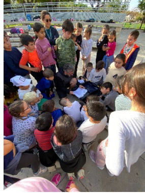
Foto 12. Trabajo en equipo para encontrar los códigos