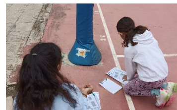
Foto 9. Alumnado encontrando el control para ubicarlo en el mapa.

Durante las sesiones de preparación el alumnado recibió varios mensajes, algunos escritos en clave que tuvieron que descifrar y otros en video, que nos condijeron a pensar que el parque kingdom era realmente el parque Lo Torrent y que no se trataba de un cumpleaños sino de la excursión programada.