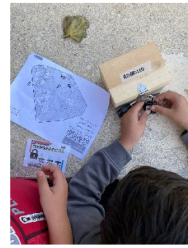
Foto 16. Mapa con los controles, ficha de registro y caja con mensaje secreto

Tanto por parte del profesorado como del alumnado se ha valorado positivamente el este tipo de trabajo que ha permitido el desarrollo de las competencias específicas de Educación Física manteniendo un alto grado de motivación y participación del alumnado. Este es un ejemplo de muchos que se realizan en nuestro Centro que apuesta por una formación de calidad, una educación para la vida y una mejora del contexto en el que se encuentra, convirtiéndonos en uno de los ejes vertebradores del barrio.