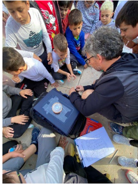
Foto 11. Conseguimos abrir el maletín con los mapas