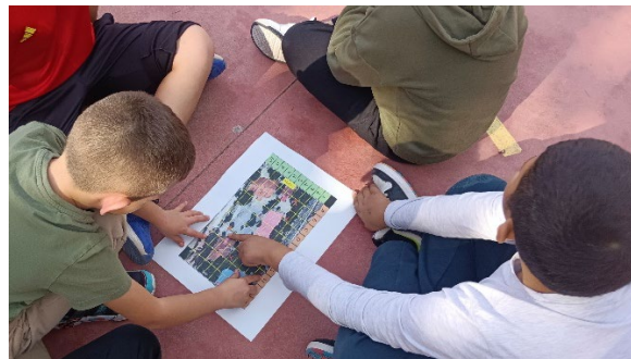
Foto 2. Grupo orientando el mapa con puntos de referencia.

Continuamos con un trabajo más específico a través de resolución de problemas multinivel con la ayuda del recurso Go4orienteing.