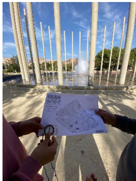
Foto 14. Utilizando la brújula para orientar el mapa