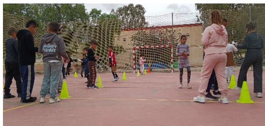
Foto 3. Trabajo individual de ubicación en el espacio.

Continuamos con un trabajo más específico a través de resolución de problemas multinivel con la ayuda del recurso Go4orienteing.