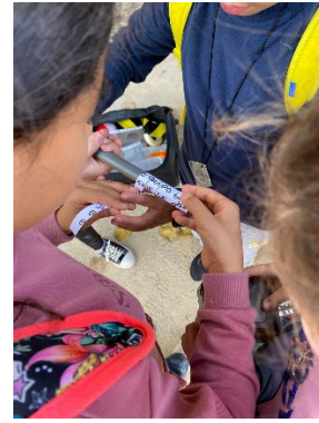
Foto 13. Descifrando mensajes secretos