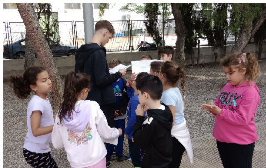
Foto 1. Grupo junto al monitor del Ayuntamiento.

Empezamos la preparación aprendiendo a utilizar un mapa de la mano de la actividad organizada por el Ayuntamiento en el propio Centro.