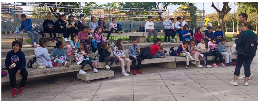
Foto 10. Inicio de la actividad en el Parque Lo Torrent.

Durante la excursión el alumnado de 3º y 4º de Primaria realizaron una ginkana donde tuvieron que superar un total de 63 pruebas, encontrar balizas en el parque con códigos numéricos que abrían candados con pistas que nos llevaron a la clave final y desactivar la bomba.