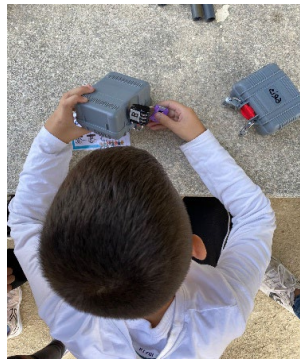
Foto 15. Introduciendo los códigos para abrir el candado