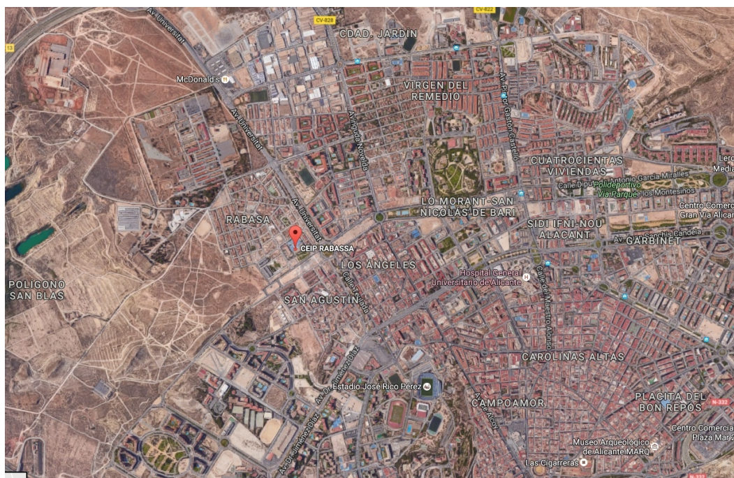
Figura 1: Ubicació del CEIP Rabassa al nordoest de la ciutat d'Alicant