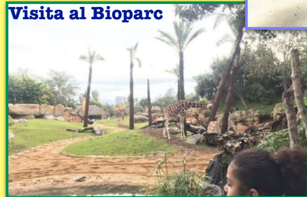
Visita al Bioparc