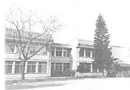
CEIP Maestro Tarrazona