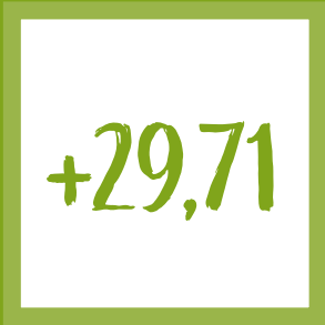
ALUMNOS FORMADOS RESPECTO CURSO ANTERIOR