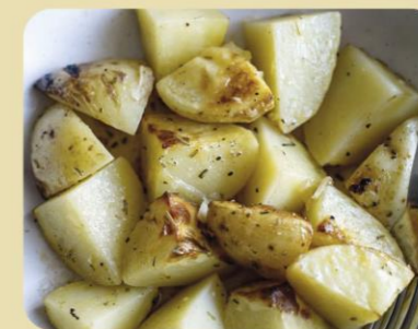
PATATAS AL HORNO CON ROMERO

Utilizar especias en la cocina nos ayuda a mejorar el sabor de nuestros platos además de favorecer la aceptación de alimentos que gustan menos en los más peques. Os animamos a utilizarlas en casa con las siguientes recetas: