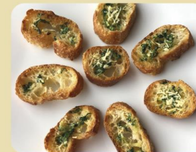
TOSTADITAS DE AJO Y QUESO CON PEREJIL