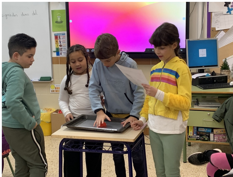
Alumnat de 4rt exposant el seu experiment

Els alumnes de 4t del col·legi CEIP l'Alba han fet experiments en l'assignatura de ciències. Els ha quedat molt bé i s'ho han passat genial. Van fer els experiments abans de Nadal, i han sigut sobre la duresa, la calor, el color, la llum, que es el raig i la impermeabilitat. Els equips que han realitzat els experiments són els següents: l'Equip Mitològic, The Barças, Les 4 estacions, The Italians, l'Equip Esportista i The màgics. Tots i totes han fet un molt bon treball.