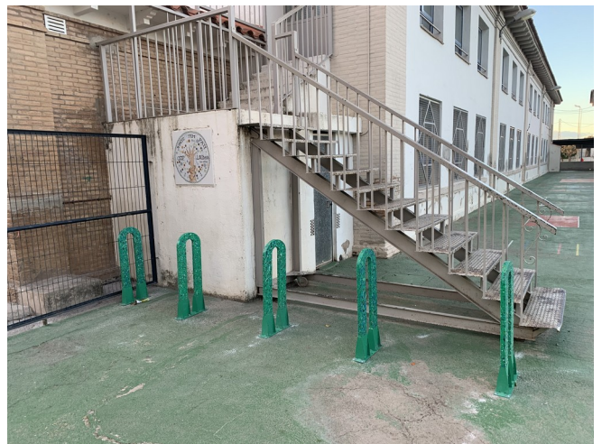
Els aparca bicis