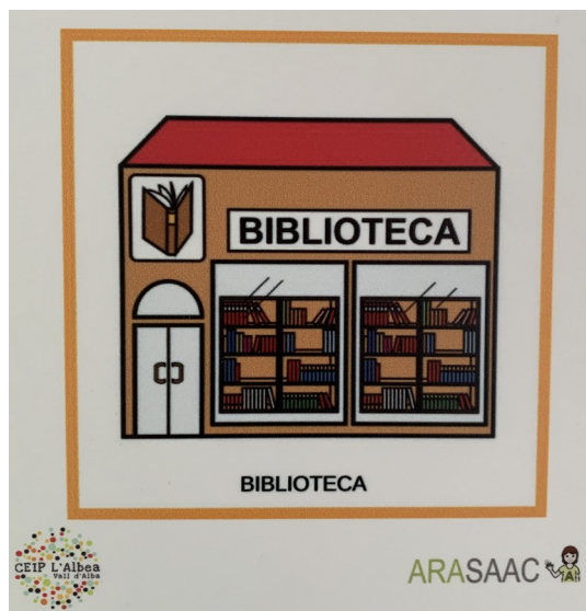
Pictograma de la biblioteca