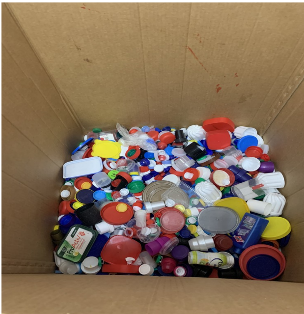
Els taps dels aparca bicis

Abans, n'hi havia persones que per poc un cotxe els trenquen la bici, ja que la deixaven a la meitat del carrer, perquè la bici pesa molt. Ara poden deixar-la als aparca bicis que hi ha pel poble, com per exemple al pinar del Pou Ample o al pati de l'escola.