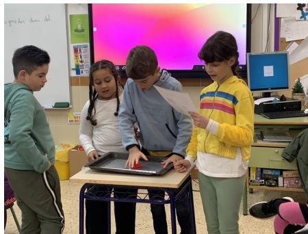
Els xiquets i xiquetes de 4 t exposant el seu experiment sobre qué és el raig