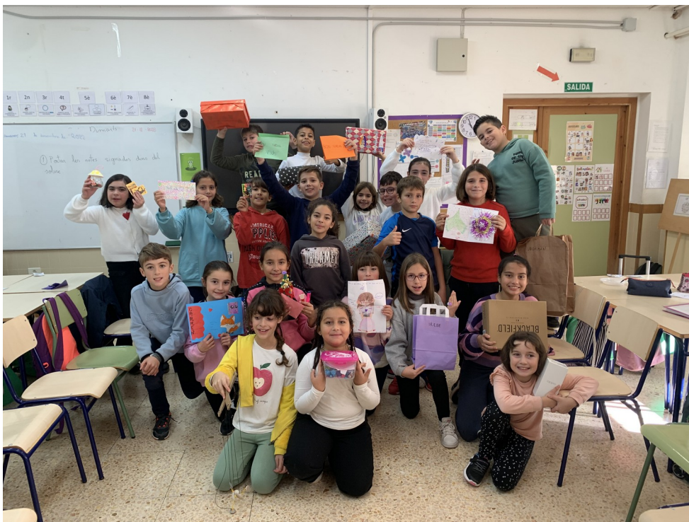
La classe de 4 t reben els regals del amic o amiga invisible

Van haver molts regals, però vam aprendre que el més important és estar tots i totes junts i juntes.