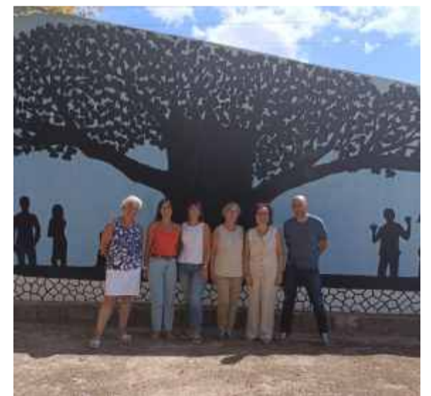
Equip Directiu i claustre del CMFPA Canals

Volem agrair també l'implicació de l'actual equip de govern i en concret de la Regidora d'Educació que sempre ha cregut en la Formació de Persones Adultes i del paper que este servei públic desenvolupa en un poble com Canals. Esta implicació és fonamental per garantir que la segona oportunitat que oferim a la població adulta d'actualitzar i millorar la seua educació no passe desapercibuda i siguem visibles en tots els àmbits de la societat del poble.