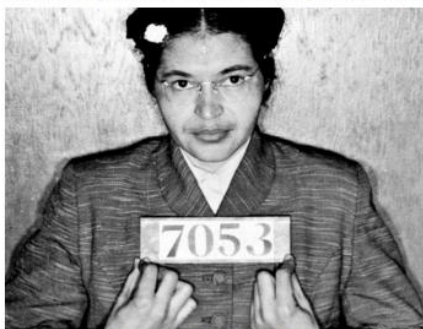
Esta es la foto policial que tomaron de Rosa Parks en la oficina del sheriff de Montgomery el día de su arresto

A medida que el autobús recorría su ruta, comenzaron a faltar asientos y quedaron de pie algunas personas. Al darse cuenta de que había gente blanca de pie, el conductor paró el autobús para pedir a tres mujeres negras que se levantaran. Rosa Parks se negó a hacerlo, y no lo hizo ni cuando el conductor amenazó con denunciarla. Finalmente, Rosa Parks fue arrestada, enjuiciada y condenada por transgredir el ordenamiento municipal.