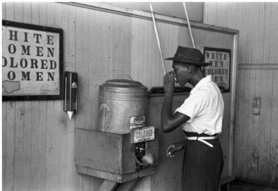
Un hombre bebe de una fuente en la que hay separación para el uso según el color de piel. La segregación causa gran incomodidad a muchas personas en su vida diaria, pero se introduce en la sociedad hasta tal punto que puede llegar a parecer natural a mucha gente, que ni siquiera la percibe

En los países donde ha existido segregación racial, las personas afectadas han carecido de derechos como el voto, el acceso a la educación o la atención médica y han sido separados en los lugares públicos. El acceso a muchos lugares públicos, como cafeterías, cines, playas o baños, estaba prohibido o restringido.