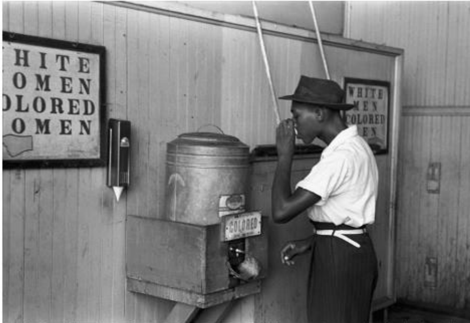
Un hombre bebe de una fuente en la que hay separación para el uso según el color de piel. La segregación causa gran incomodidad a muchas personas en su vida diaria, pero se introduce en la sociedad hasta tal punto que puede llegar a parecer natural a mucha gente, que ni siquiera la percibe

En los países donde ha existido segregación racial, las personas afectadas han carecido de derechos como el voto, el acceso a la educación o la atención médica y han sido separados en los lugares públicos. El acceso a muchos lugares públicos, como cafeterías, cines, playas o baños, estaba prohibido o restringido.