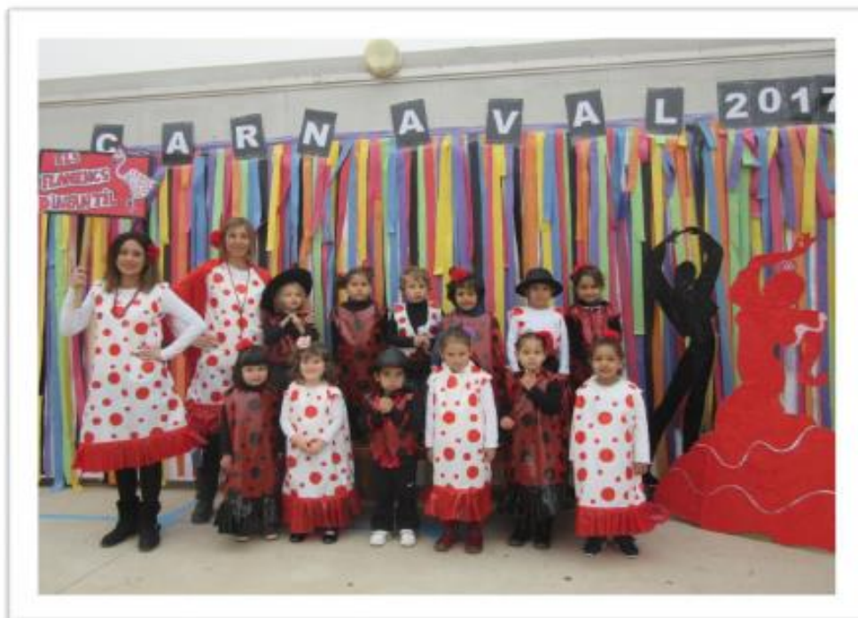
Infantil 3 anys A