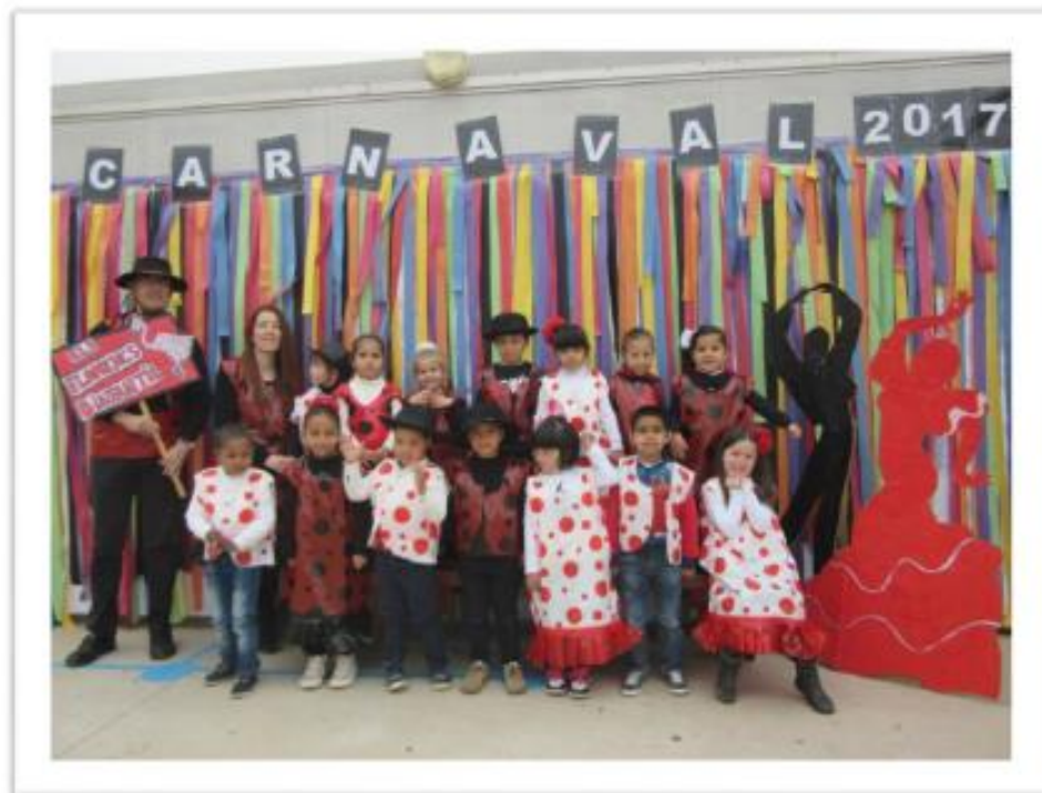
Infantil 4 anys B