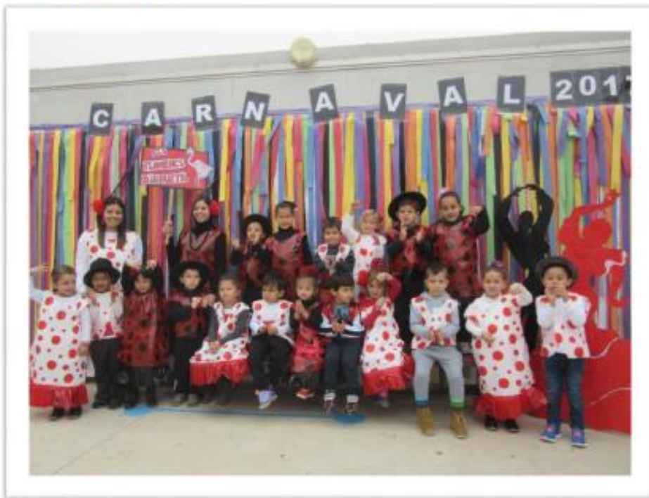
Infantil 4 anys A