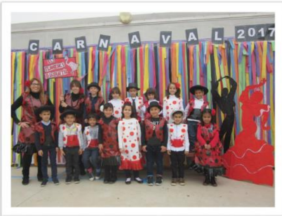
Infantil 5 anys A