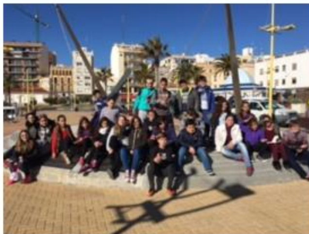
Els marines de 6è