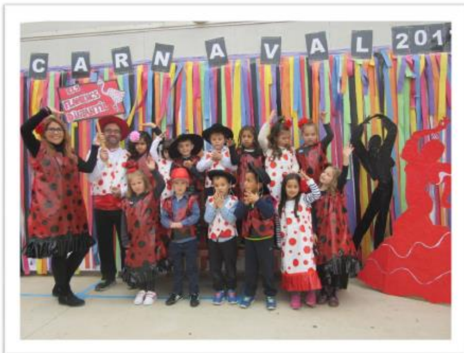
Infantil 5 anys B