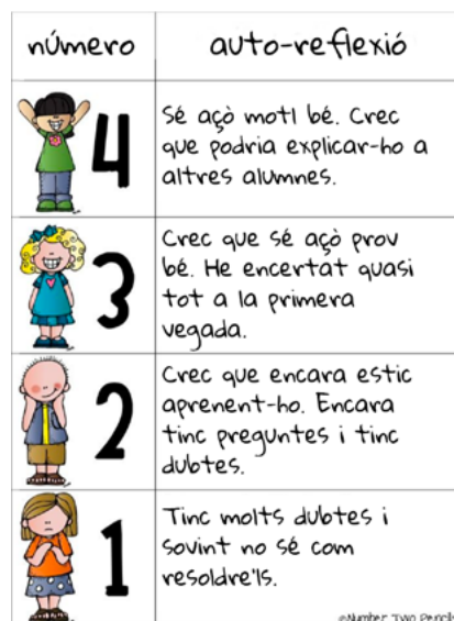
Imatge 1: Autoreflexió

Adaptació: M. S. (2017, January 3). Self reflection . (N. T. Pencils, Ed.)